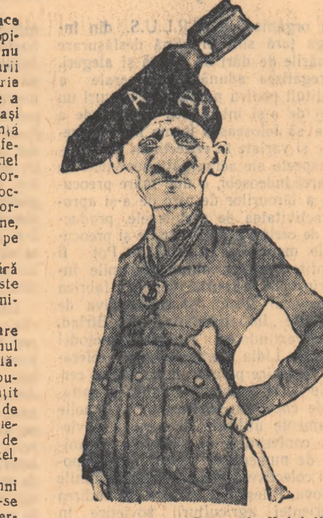
Desen de Kukrnikist