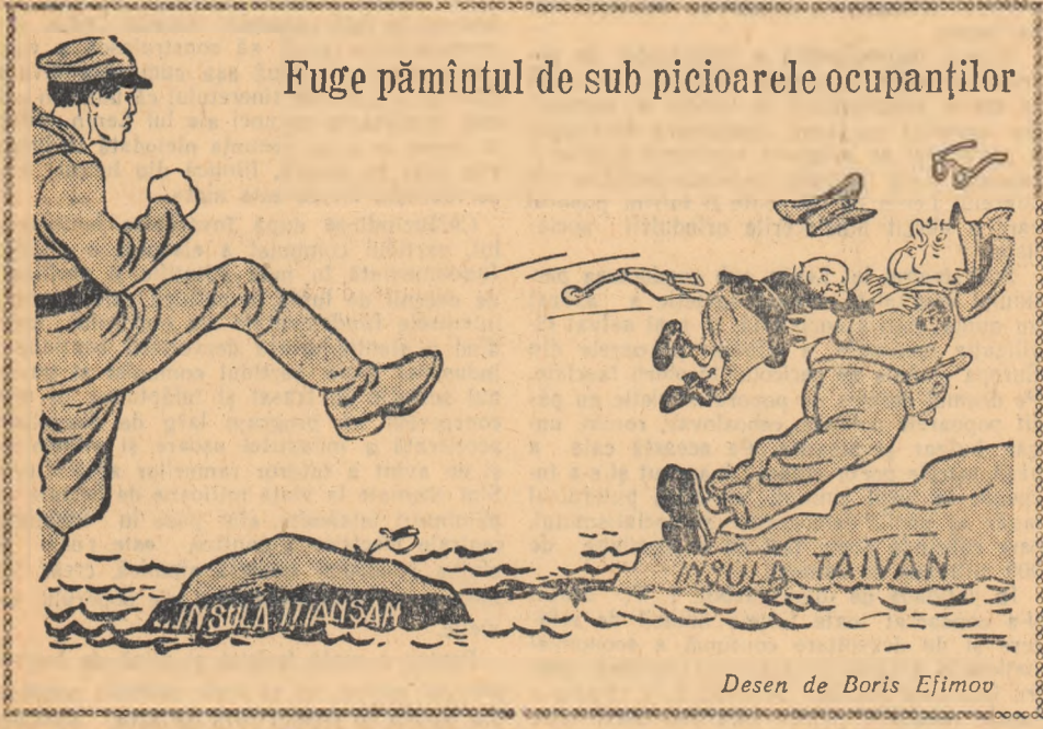
Desen de Boris Efimov

Autoritățile boniste sînt neliniștite de creșterea continuă a nemulțumirii populației față de politica lui Adenauer.