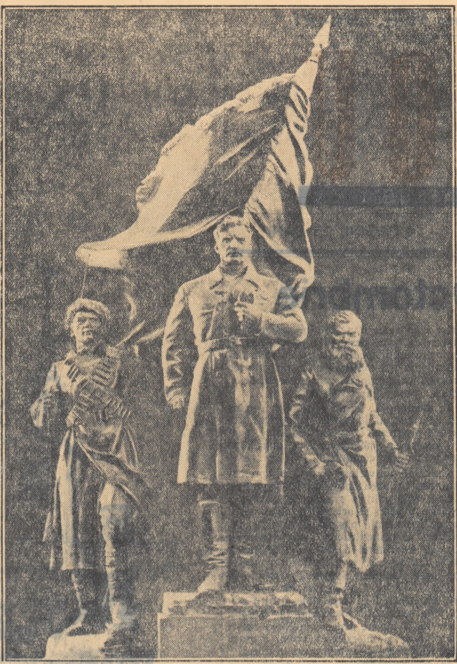
„Pentru Puterea Sovietelor” sculptură de A. P. Faidis-Krandievski.