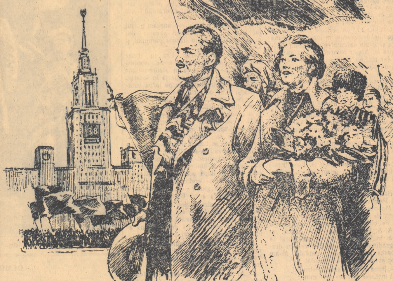
Desen de V. Bogatkin

Sărbătorînd, alături de popoarele sovietice, marea zi de 7 Noiembrie, poporul român își afirmă hotărîrea de a lupta cu și mai mult avînt pentru ca pe drumul Marelui Octombrie, să cucerească noi succese în opera de construire a socialismului, de făurire a unui viitor fericit tuturor celor ce muncesc.