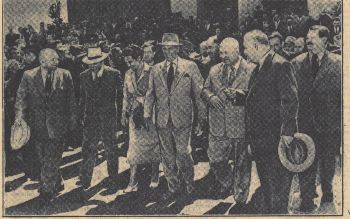
În timpul șederii sale în U.R.S.S., tovarășul Iosif Broz-Tito, președintele Republicii Populare Federative Iugoslavia...