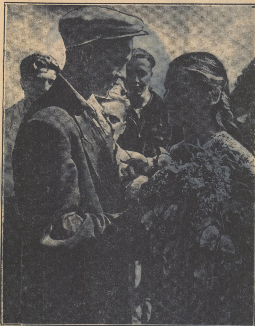
Despărțirea nu e grea, pentru că nici nu e, de fapt, despărțire. Fata va pleca să construiască mari uzine și hidrocentrale în Siberia. Dar ochii fetei, care-și ia rămas bun de la fiacul drag, zimbosc mai mult a chemare. El o va urma în curând.