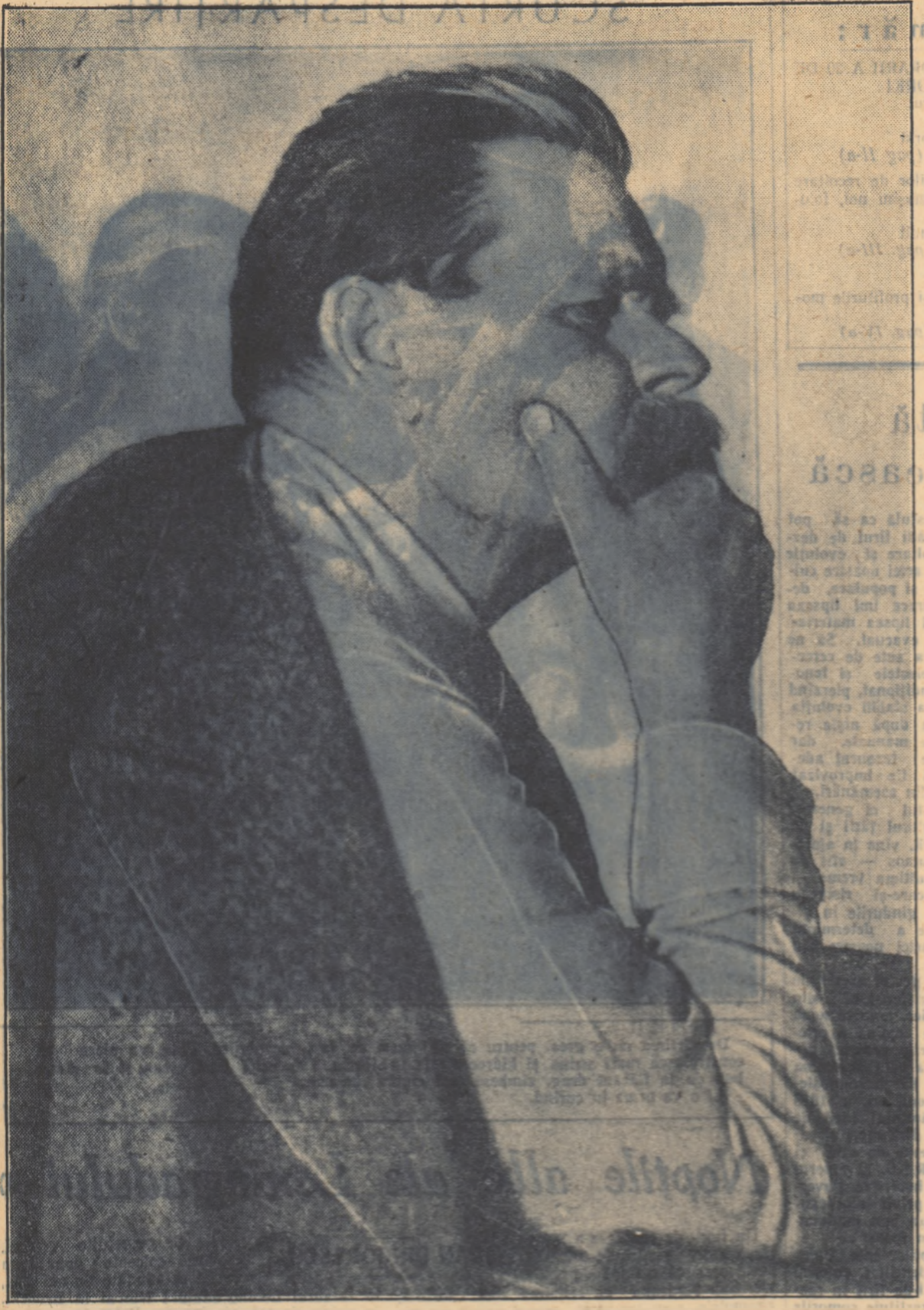
La 18 iunie, se împlinesc 20 ani de la moartea lui Maxim Gorki

Am pomenit aici de ecoul operelor lui Gorki înainte de 23 august 1944. După această dată, traducerile lui Gorki s-au făcut în mod sistematic și în incomparabil mai bune condiții de fidelitate și de formă decît mai înainte.