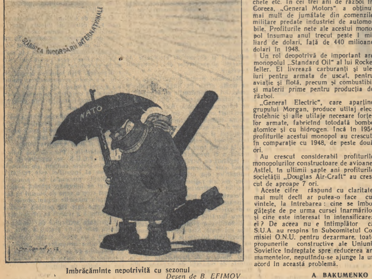
Imbrăcămintă nepotrivită cu sezonul. Desen de B. EFIMOV