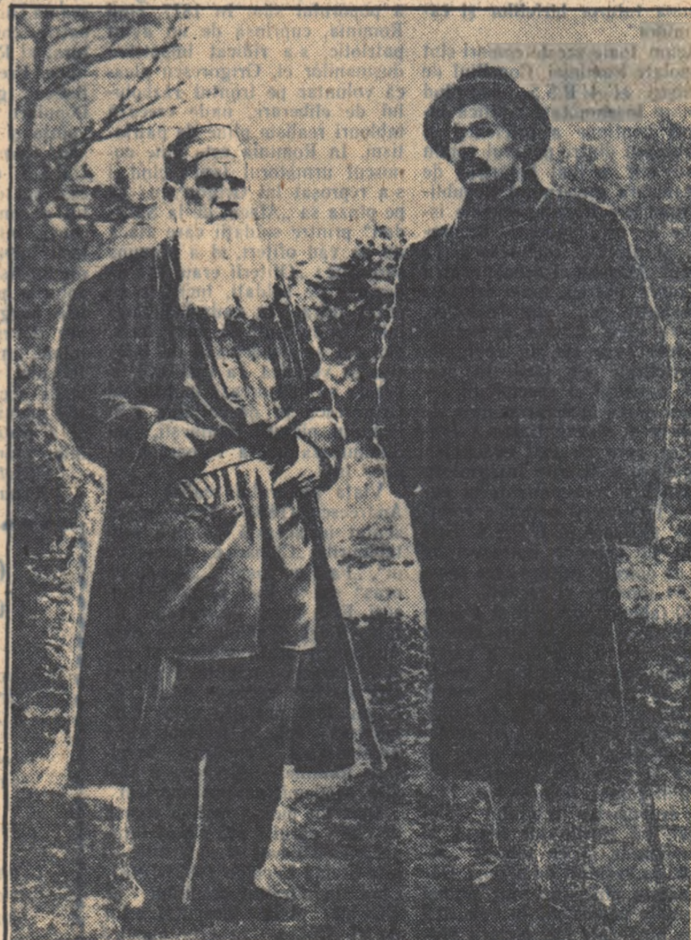
Lev Tolstoi și Maxim Gorki la „Iasnaiia Poleana”.