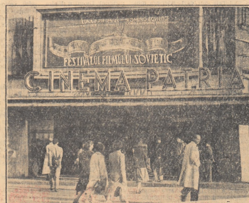
„Festivalul filmului sovietic” oferă cinefililor posibilitatea să vizioneze în premieră unele dintre cele mai noi creaţii ale cinematografiei sovietice.