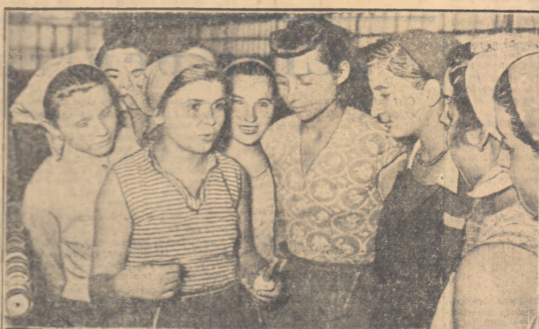
Consfătuire despre foloasele aplicării metodelor sovietice la o filatură din Capitală.