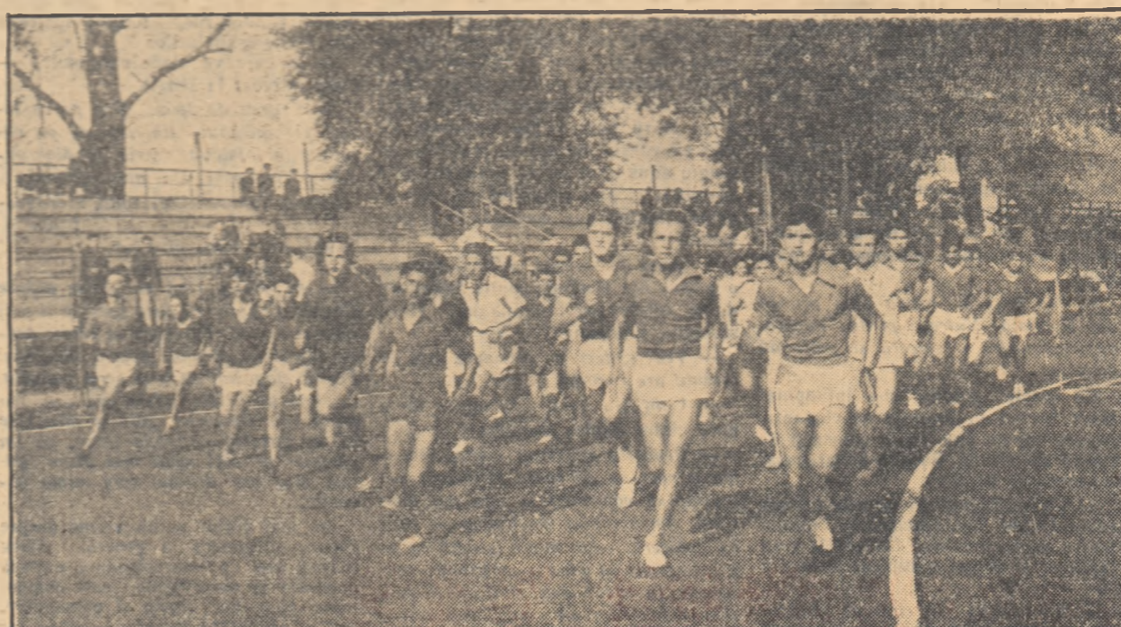
De multă popularitate se bucură în rindul sportivilor tradiţionalul cross: „Să întâmpinăm 7 Noiembrie”. Fotoreporterul a surprins momentul când s-a dat startul pentru cursa de 1.500 de metri.