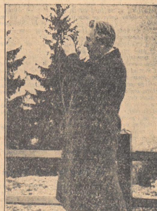
Minunatele privelişti ale Carpaţilor au făcut să vibreze sensibilitatea regizorului sovietic A. M. Room.