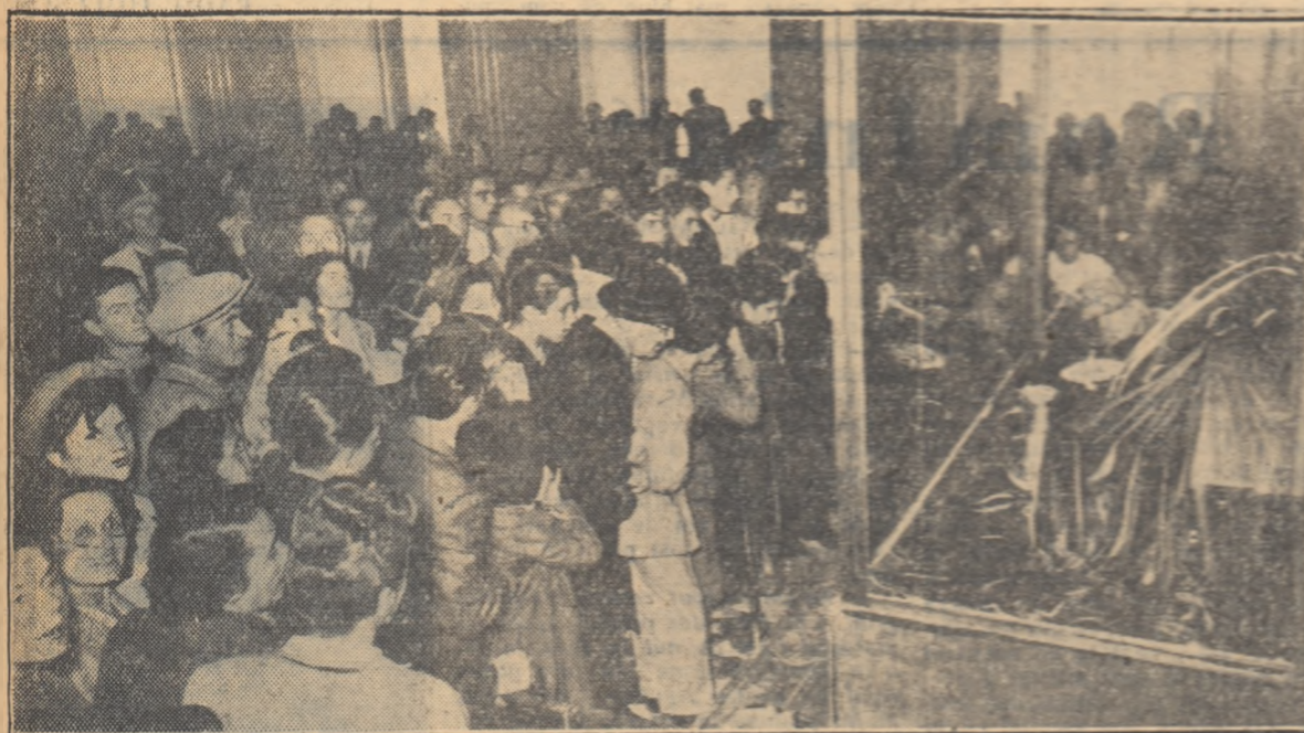
În cursul zilei de duminică, mii de oameni veniţi din toate colţurile ţării au vizitat Expoziţia tezaurului de artă care ne-a fost restituit recent de către guvernul sovietic.