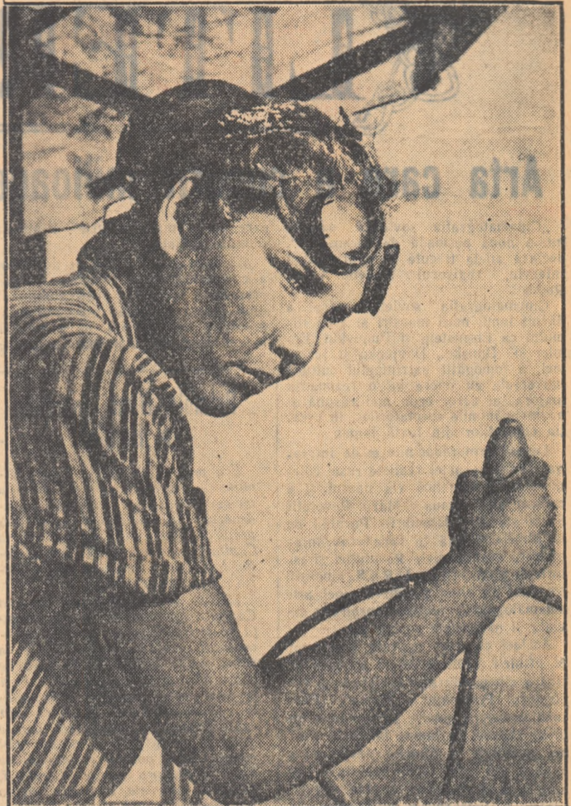
Cu mina pe volanul combinel, comsomolista scrutează zarea