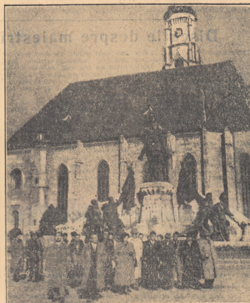
Oaspeţii sovietici în oraşul Cluj.