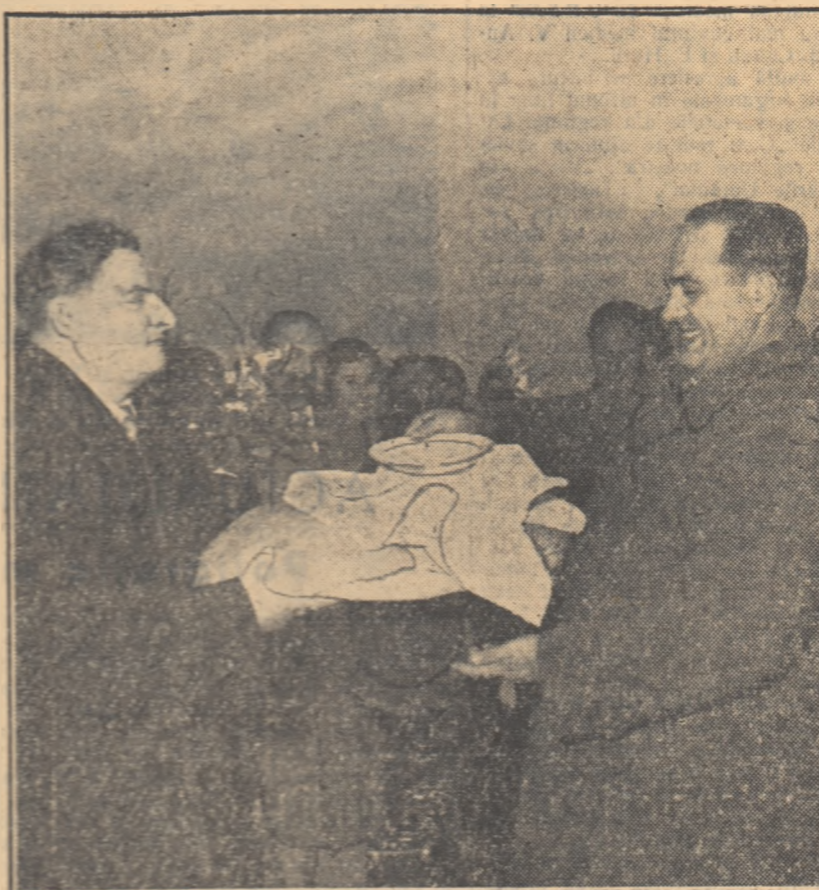
La punctul de frontieră Alba Iulia. Oaspeţii din R. S. S. Moldovenească, veniţi să participe la marea serbare a prieteniei romino-sovietice care a avut loc la Huşi în ziua de duminică 21 octombrie, au fost primiţi cu piine şi sare de reprezentanţii populaţiei din regiunea Iaşi.