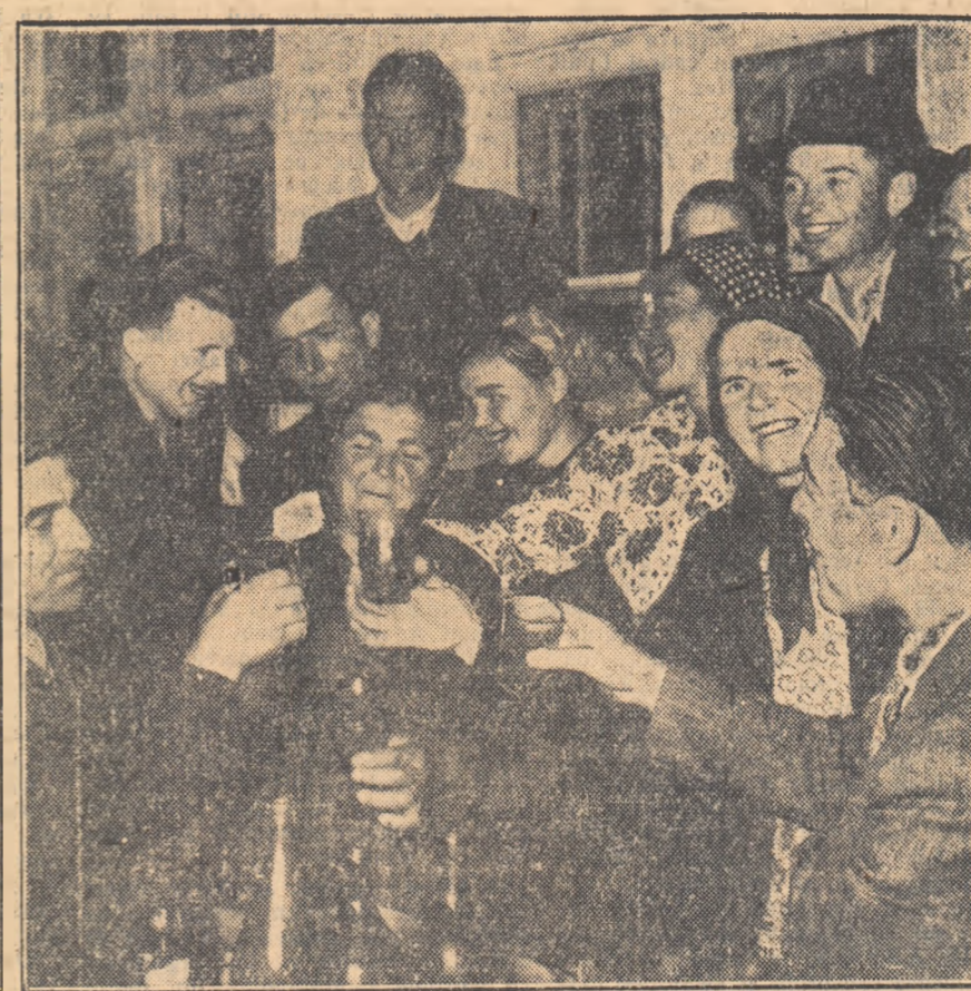
— Pentru prietenie! — Za drubju! Gazdele, colectivităţii din Tirzili, şi oaspeţii sovietici au ciocnit cu bucurie un pahar de vin nou.