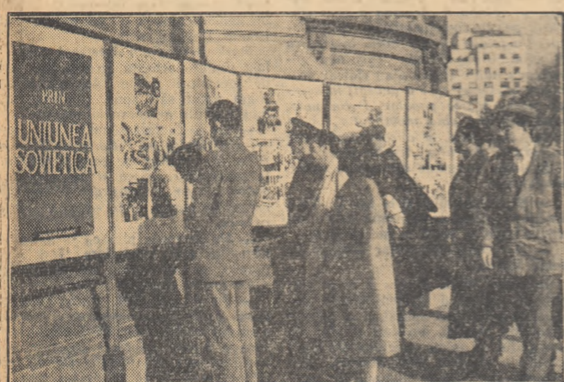
Un aspect devenit familiar cetăţenilor Capitalei: grupurile de trecători ce se opresc neconştient în faţa panourilor expoziţiei din Piaţa Universităţii, ce înfăţişează în imagini sugesive actualitatea sovietică. Această formă de informare şi popularizare a realizărilor sovietice — înfiinţată de consiliul orăşenesc A.R.L.U.S. Bucureşti — este apreciată de cetăţeni.