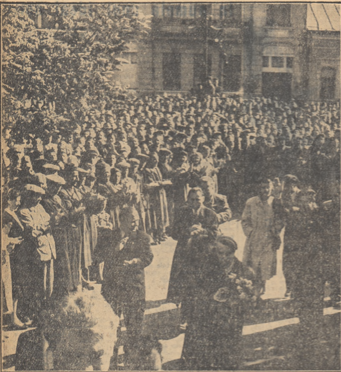
La Tg. Mureş, ca pretutindeni pe unde au trecut, mii de oameni au venit în întâmpinarea soţilor dragi ai poporului sovietic.