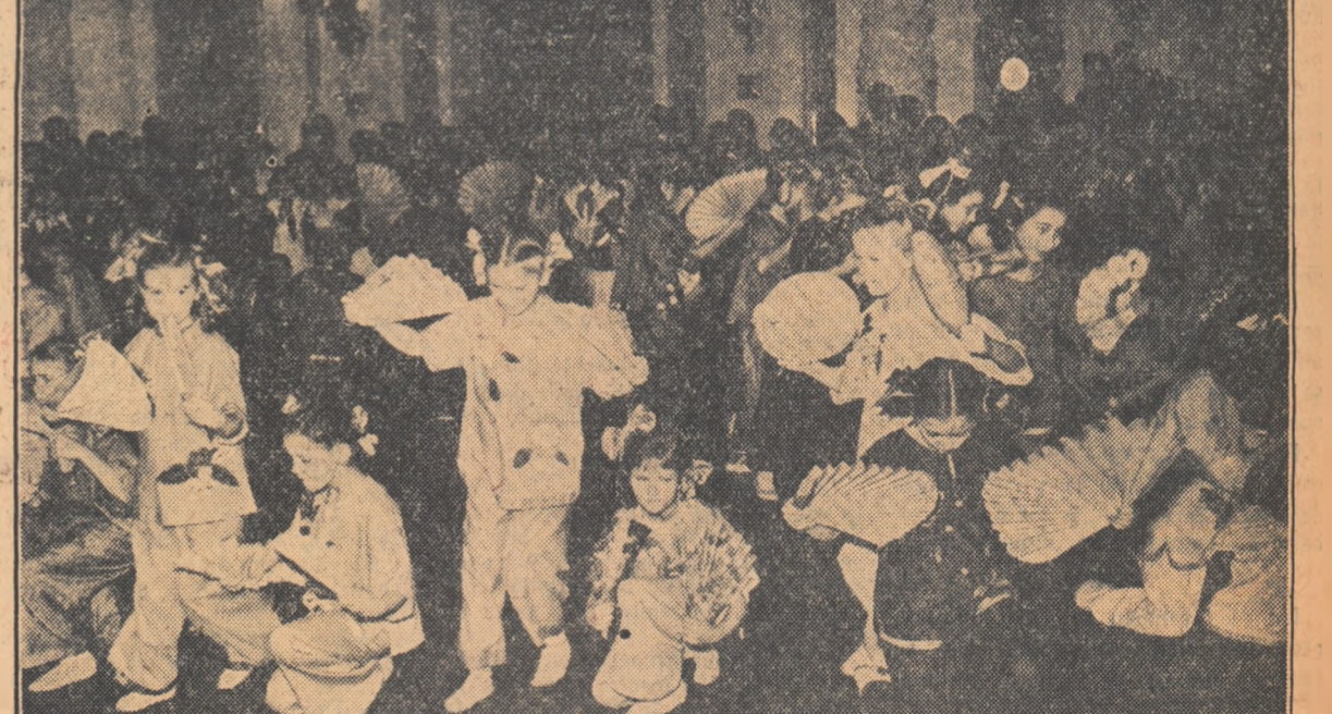
În fiecare an la Moscova, ca și în toate orașele sovietice, se organizează tradiționala serbare a pomului de iarnă. Aici, pe copiii îi așteaptă multe surprize și bucurii. Ei primesc daruri, regăsesc personajele din basmele preferate, asistă la spectacolele date pentru ei de artiști profesioniști și amatori.