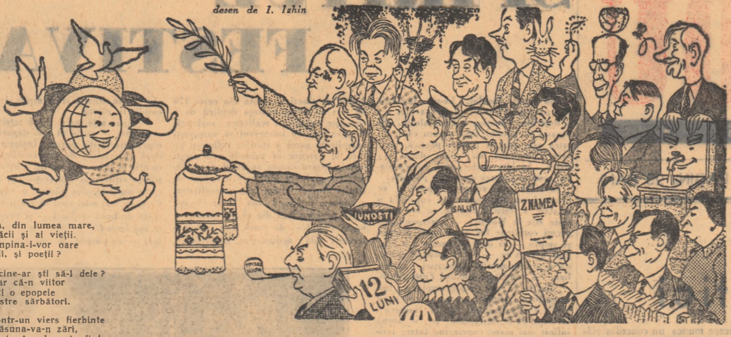
desen de I. Tchin