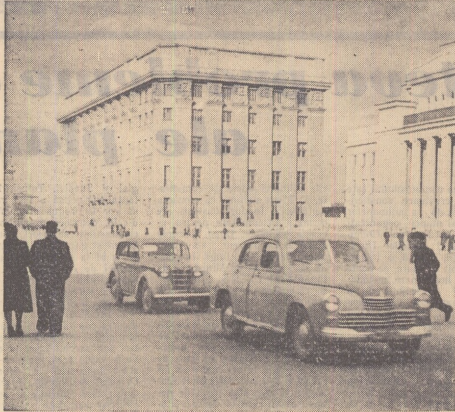
Pe bulevardul Roșu din Novosibirsk, metropola siberiană

Extremul Orient, cîndva atît de „departat“ de centrul continentului rusesc, se simte acum tot mai apropiat. Cu avionul Tu-104, în șase-opt ore se poate ajunge de la Moscova în acest „Orient Indepărtat“. Dar nu e vorba numai despre distanțele în spațiu, ci și despre distanțele în timp. Extremul Orient era față de centru la cîteva mii de km. departare și cu cel puțin două-trei secole în urmă. Timpul și spațiul se supun omului. Distanțele se anulează. Peste șapte ani, nu se va mai ști precis unde începe Orientul Indepărtat, căci în toată Tara Sovietelor va începe triumful comunismului.