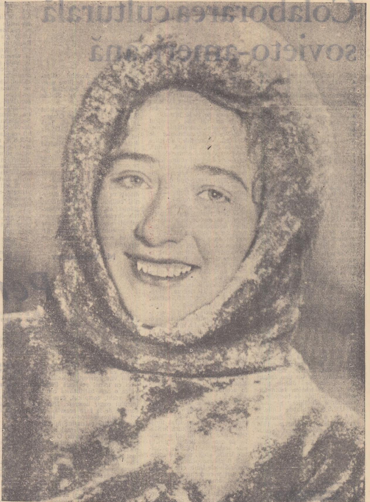
O fiică a extremului nord sovietic