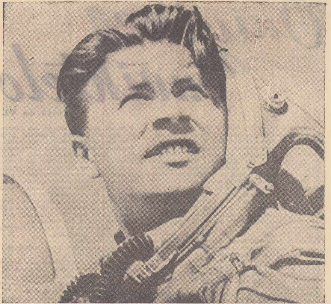
Vladimir Ilic Lenin — erou al Uniunii Sovietice, pilot pe un avion supersonic.

A doua modalitate de planare liberă prevede trecerea la traiectoria descendentă îndată ce avionul începe să se abată de la curba balistică inițială, adică după ce a ieșit din picaj. Aceasta permite planorului supersonic să se mențină la înălțime timp îndelungat. Pe măsură ce coboară, planorul își reduce treptat