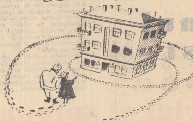
— Uite și casa mea...