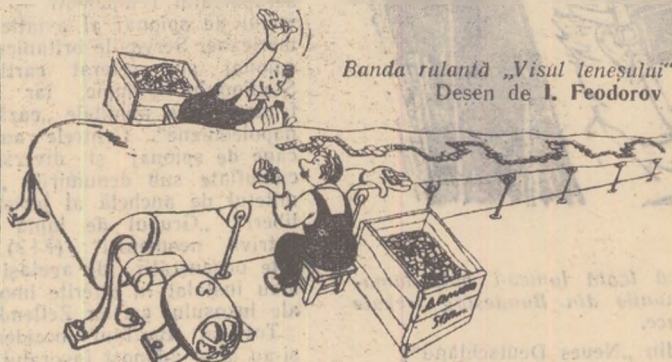
Banda rulantă „Visul leneșului” Desen de I. Feodorov