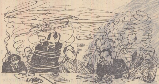
La conștientizarea consacrată problemei asanării atmosferei orașului. Desen de A. Kanevski