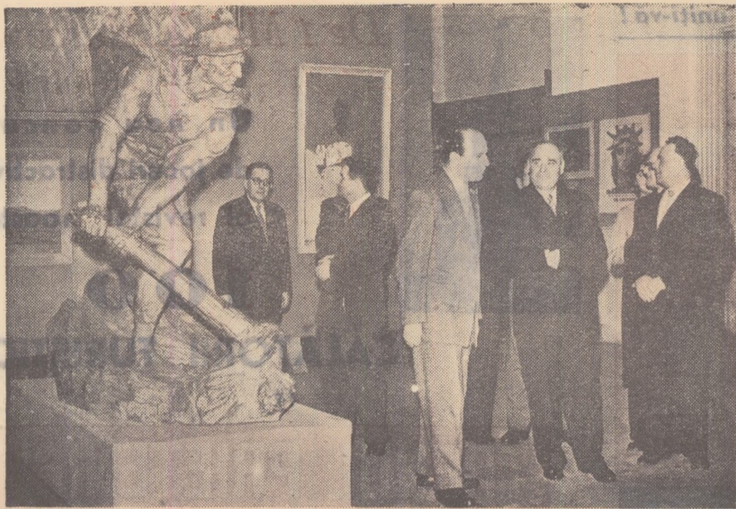
In zilele Congresului al XXI al P.C.U.S. delegația Partidului Muncitoresc Român în fruntea tovarășului Gh. Gheorghiu-Dej a vizitat Expoziția de artă plastică a țării socialiste