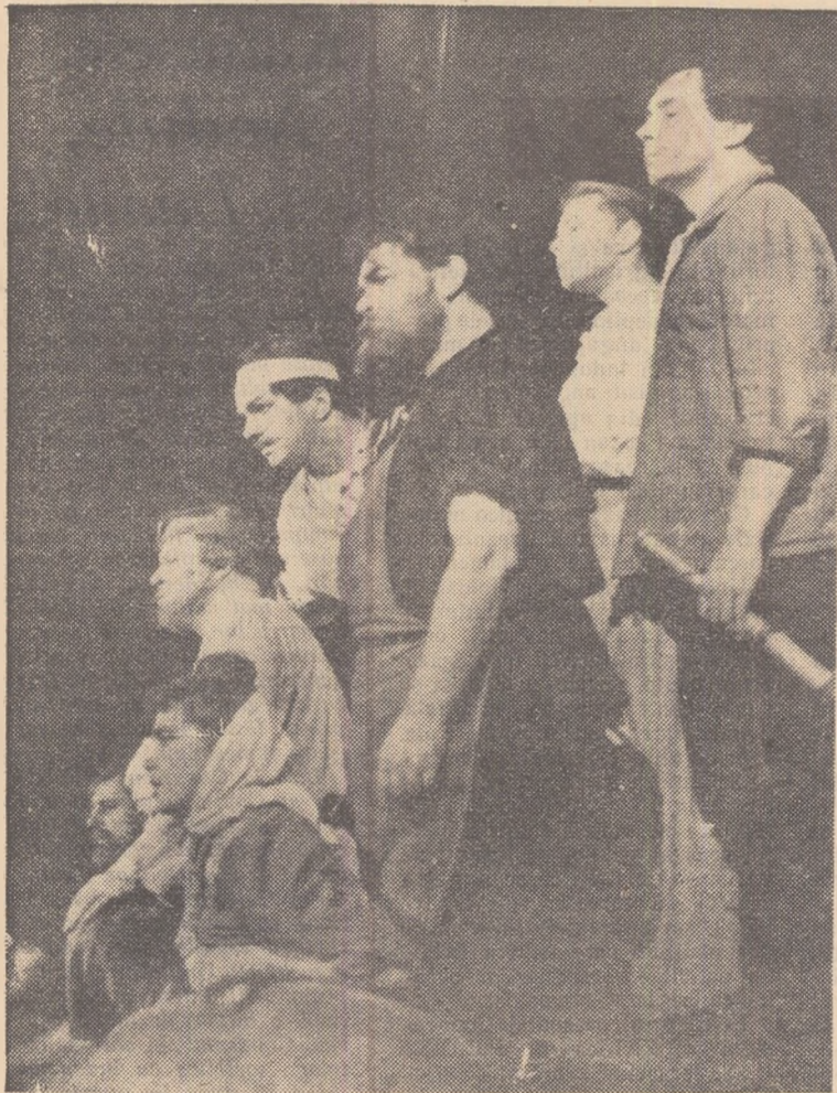
Grupul proletarilor din „Misterul buf“