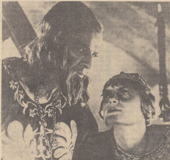
Cadru din filmul „Ivan cel groaznic”

Autenticitatea filmului este sporită de faptul că în multe din scenele de luptă sînt intercalate reportaje făcute pe front de operatorii cinematografici sovietici. Printre acestea se află și reportajele lui Vladimir Sușcinski.