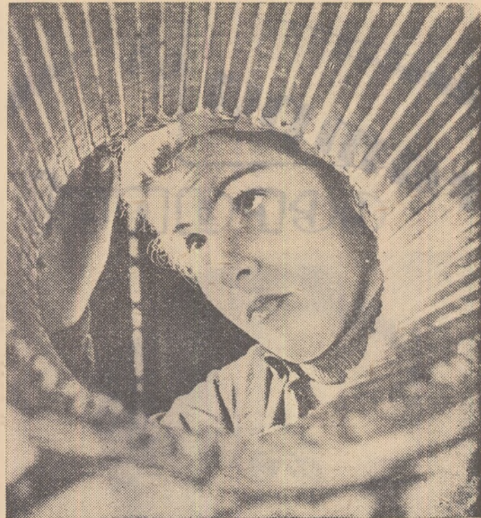
In secția de electromotoare a uzinei Boreț

Se recomandă ca acest material — în care se tratează despre dezvoltarea industriei sovietice în anii planului septenal — să fie folosit la pregătirea expunerilor în întreprinderi.