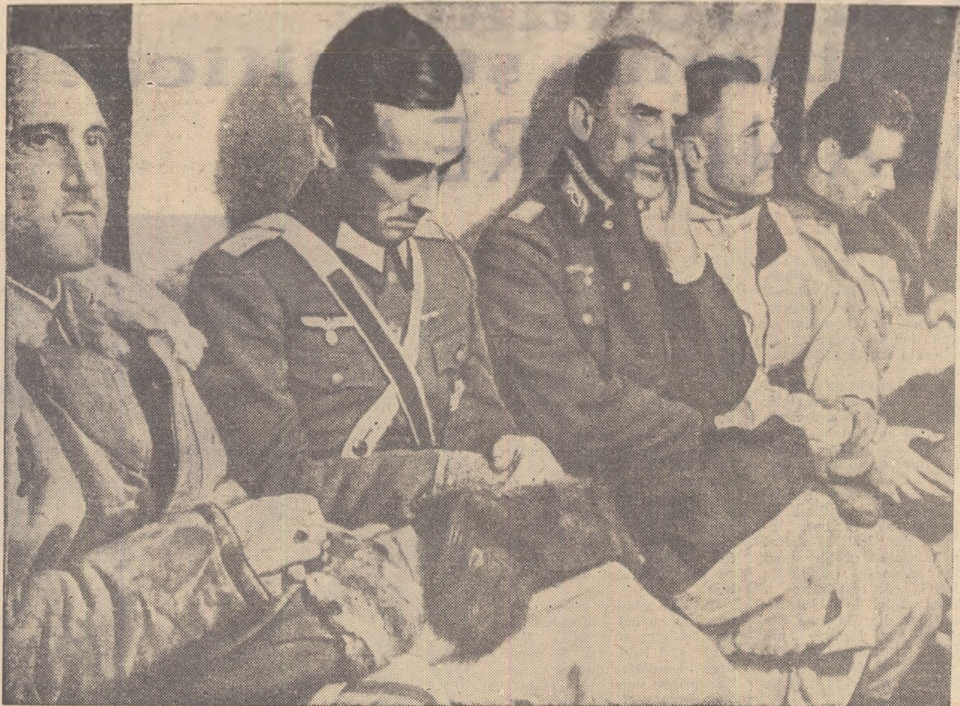
...lata cum s-a sfârșit pentru agresori bătălia de la Stalingrad. Trupele sovietice au nimicit aici 22 de divizii și au luat 91.000 de prizonieri, între care 24 de generali.

...ezentind evenimentele care au urmat războiului, Manstein încearcă să imită cititorului ideea că grupul său de armate denumit „Don“ a reușit, chipurile, să localizeze succesul nostru de la Stalingrad și chiar, într-o oarecare măsură, să aprobe lovitură noastră, pregătind totuși condițiile pentru operațiunile ofensive ulterioare ale hitleriștilor. De asemenea, încearcă să impună ideea că numai „greșelile“ „făurite“, concretizându-se în trăgănarea începutului ofensivei din vara anului 1943, au fost cauzele „pierderii“ aceste victorii. 8) În realitate, ținind seama de afirmațiile lui