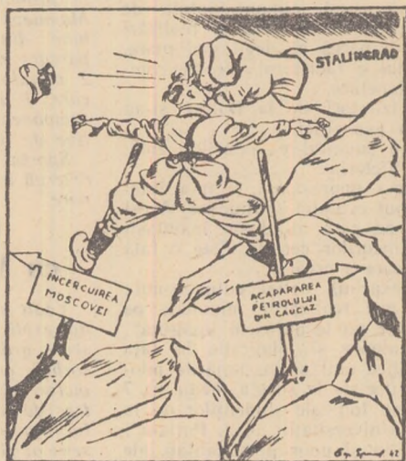
Desen de B. Efimov, (1942)

grad ca punct de cotitură al războiului, dar se exprimă într-o astfel de formă și cu atâtea rezerve încât, în fond o reduce la zero.