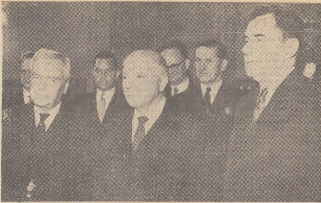
Intre 18-24 aprilie, Walter Nash, primul ministru al Noii Zeelande a făcut o vizită în U.R.S.S. În clișeu: W. Nash, K. Vorosilov și A. Gromiko, fotografiați cu prilejul întâlnirii ce a avut loc la Preziđiul Sovietului Suprem al U.R.S.S.