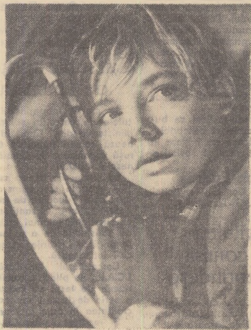
Unul dintre interpreții filmului „Pusti”

cu adevărat prietenești între toți membrii echipei, mari și mici. De altfel, în timpul expedițiilor noastre, profităm de fiecare clipă liberă pentru a ne-o petrece împreună cu interpreții noștri. Seara, organizăm împreună diferite jocuri în decursul cărora copiii își demonstrează nestîngerii talentul, ingeniozitatea. Cu acest prilej,