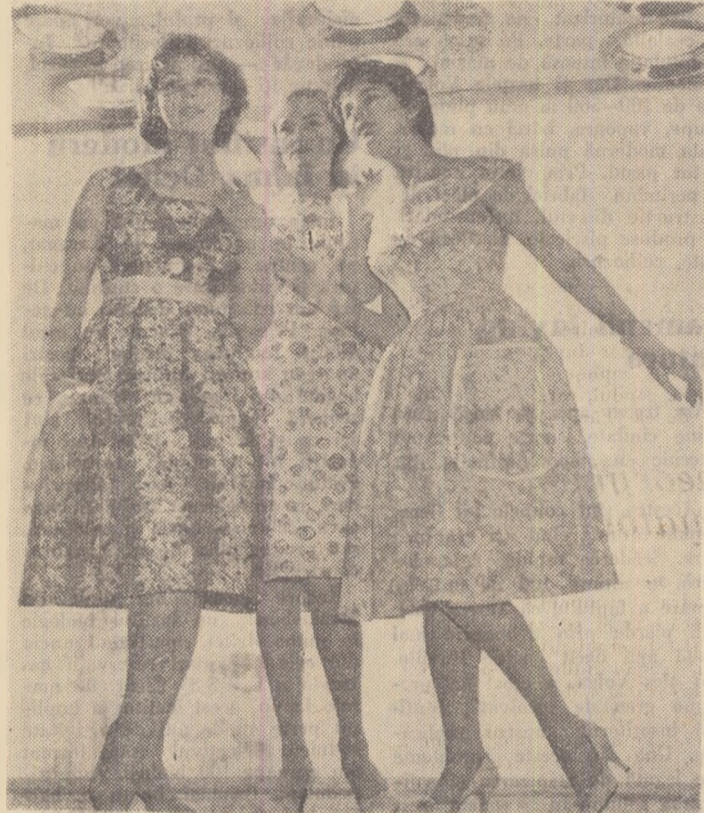
Noi modele de rochii de vară