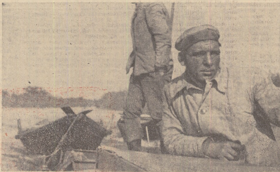
Pentru oamenii aceștia de prin partea locului, Delta nu are taine.