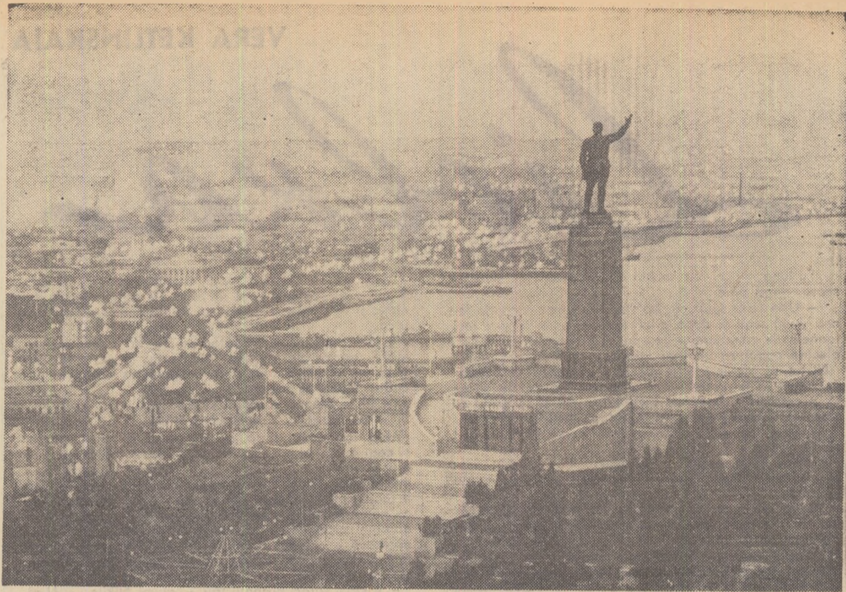
Lumini la Baku, capitala R.S.S. Azerbaidjan

Cuvintele conducătorului Statului Sovietic au fost primite ca un dar scump de poporul azerbaidjan, cu prielejul sărbătorii sale.