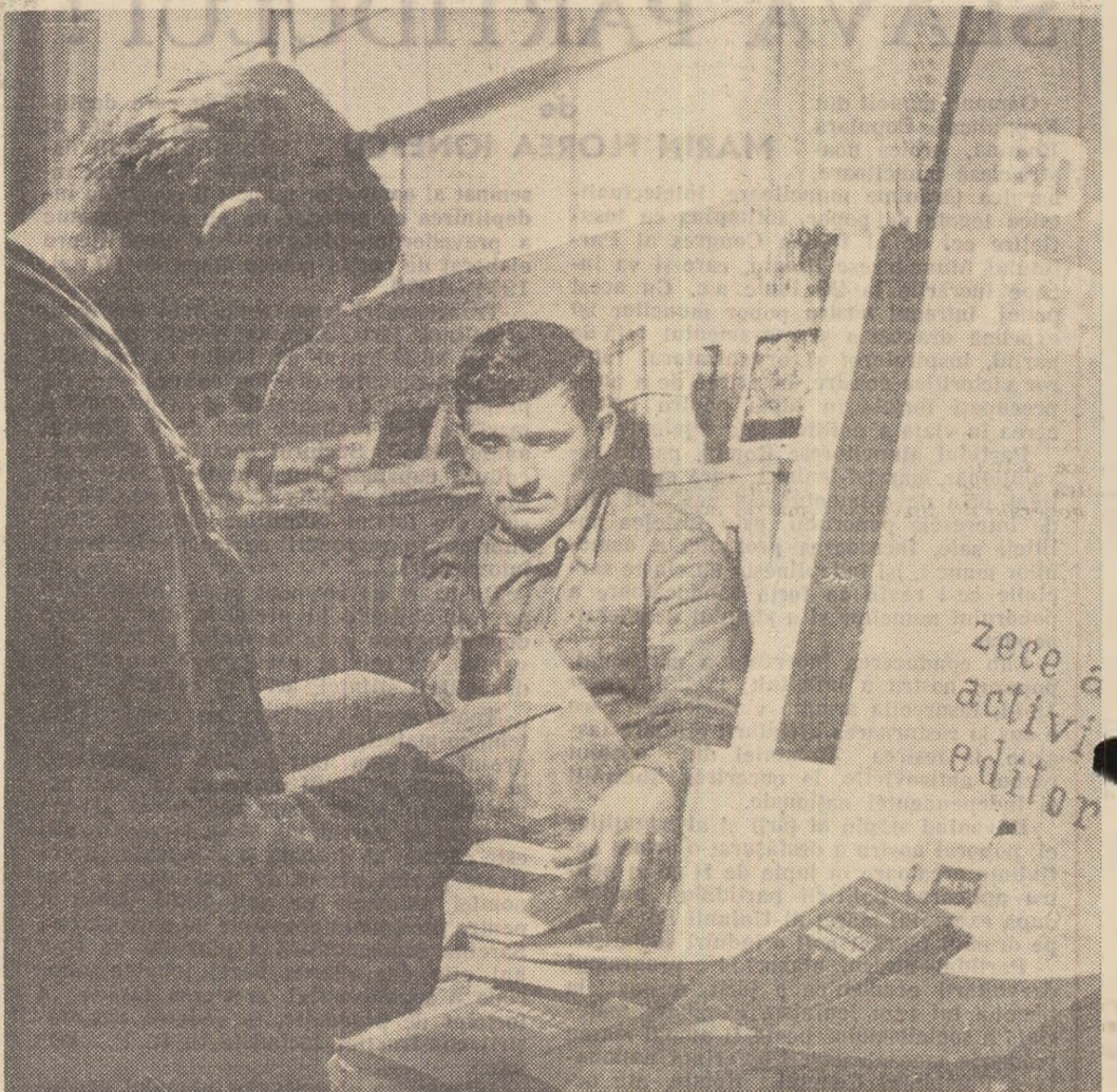
Cartea — un bun la îndemina oricui

asemenea considerabil studiile necesare pentru producerea fibrelor și firelor sintetice, ca și a fibrelor pe bază de celuloză, folosindu-se o altă bogăție naturală, valorificată pentru prima oară în anii democrației populare, aceea a stufului din Delta Dunării. Pentru creșterea continuă a nivelului de trai material al poporului muncitor, ca și pentru ocrotirea sănătății capătă o importanță considerabilă prevederile din proiectul de Di-