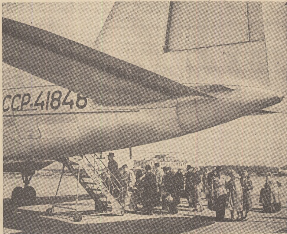
De la 1 iunie Șeremetievo, noua poartă aeriană a Moscovei, a devenit aeroport internațional. De aici pornesc linii aeriene spre Londra, Paris, Pekin, Delhi, Varșovia, Budapesta, Kabul etc.

GHEORGHII SUHORUKOV Leningrad M-6, Do vostrebovania