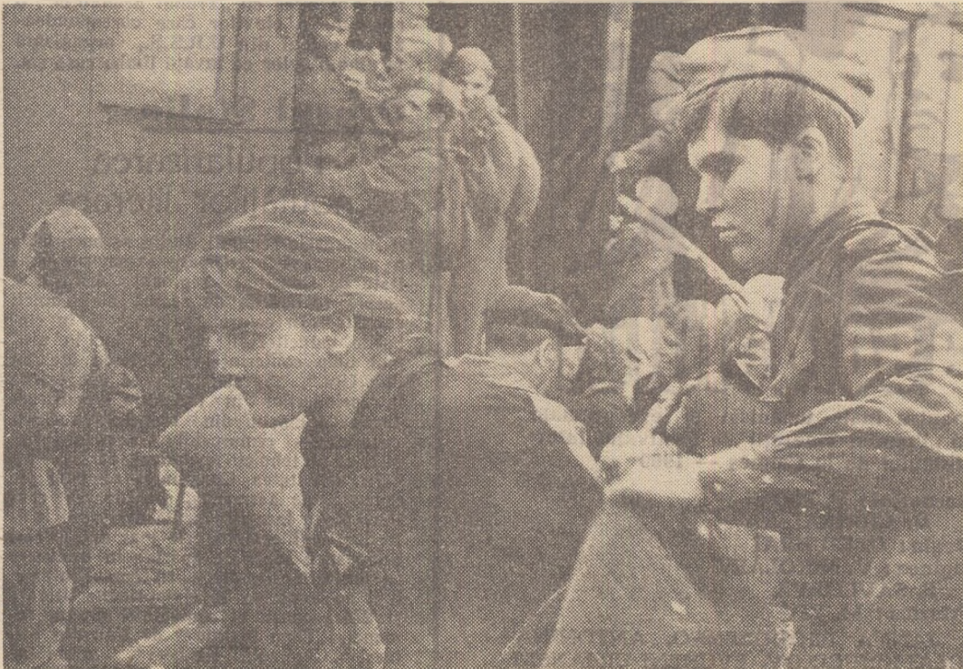
Scenă din filmul „Balada soldatului“

În ținuturile R. S. S. Tadjice se turnează exteriorul filmului „Omul își schimbă pielea“, după romanul scriitorului polonez Bruno Iasenski. Filmul va înfățișa întâmplările petrecute pe un uriaș șantier tadjik, unde se construiește un sistem de irigație menit să asigure o bogată cultură de bumbac în regiunile secetoase. Într-unul din rolurile principale apare actrița Izolda Izvițkaia.