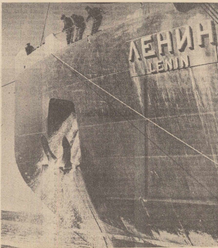
Spărgătorul de gheață atomică „Lenin” ridică ancora (de șase tone).