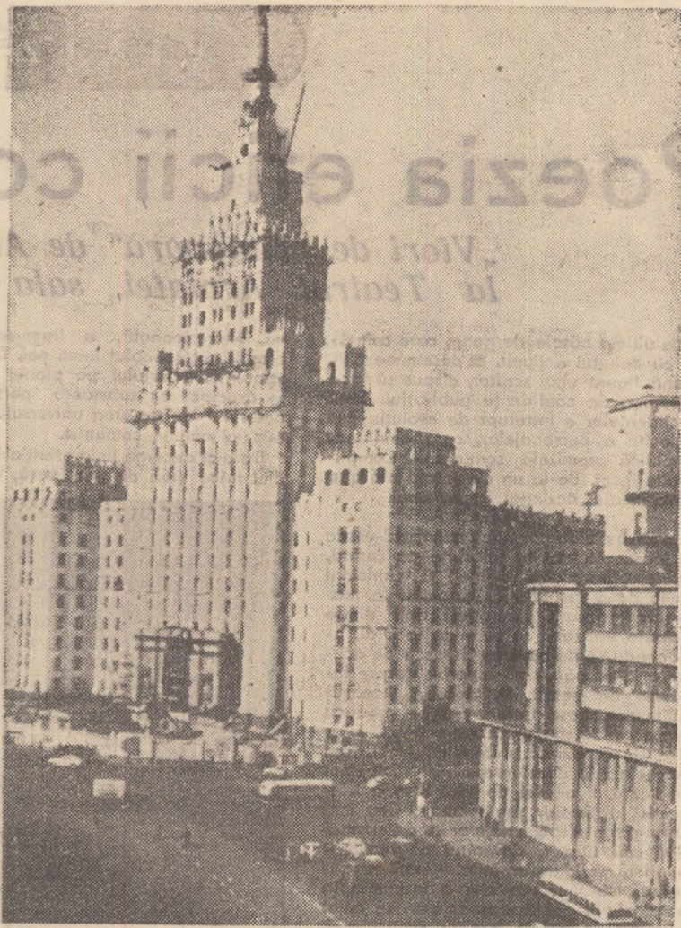
An de an, Moscova, Capitala Uniunii Sovietice, devine tot mai frumoasă. Noile clădiri, expresie a arhitecturii epocii socializmului, se integrează în chip armonios în estetica generală a marelui oraș.