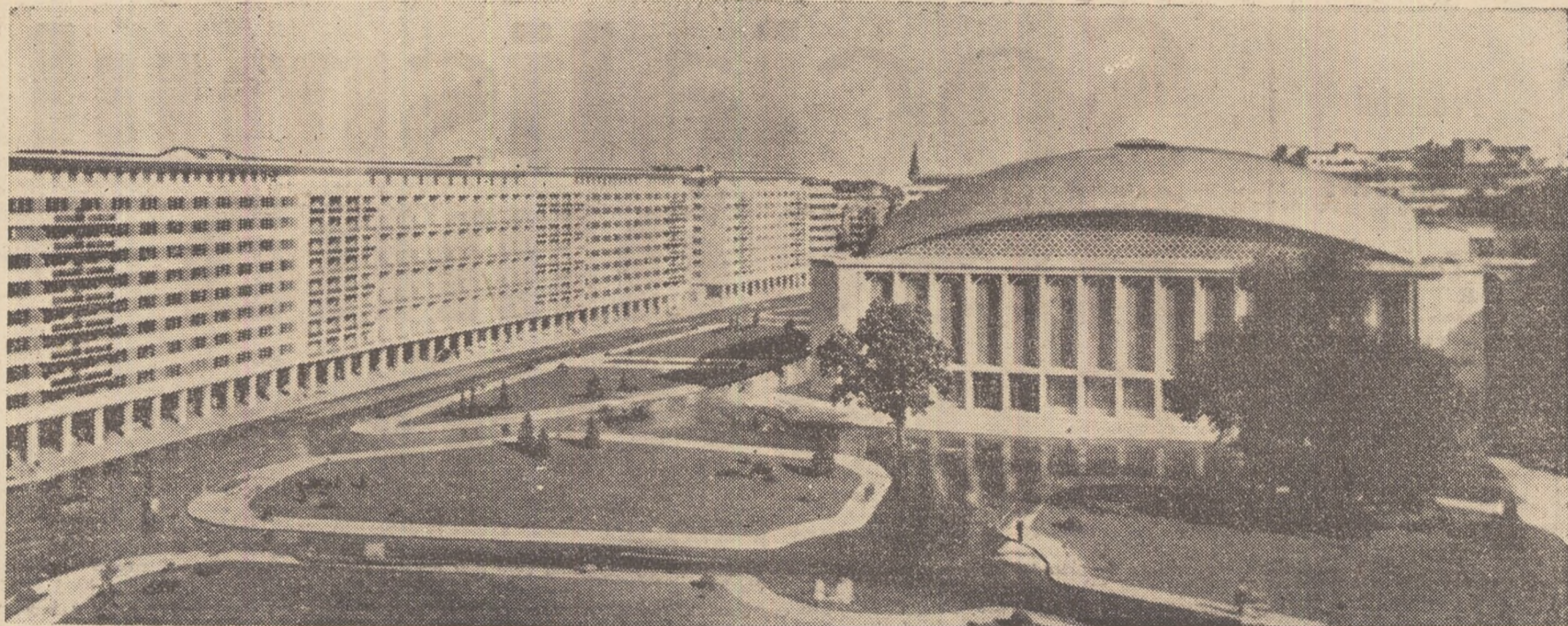
Noua sală a Palatului Republicii