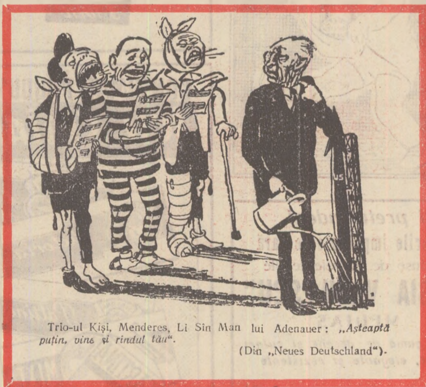
Trio-ul Kiși, Menderes, Li Sin Man lui Adenauer: „Așteaptă puțin, vine și rîndul tău”.