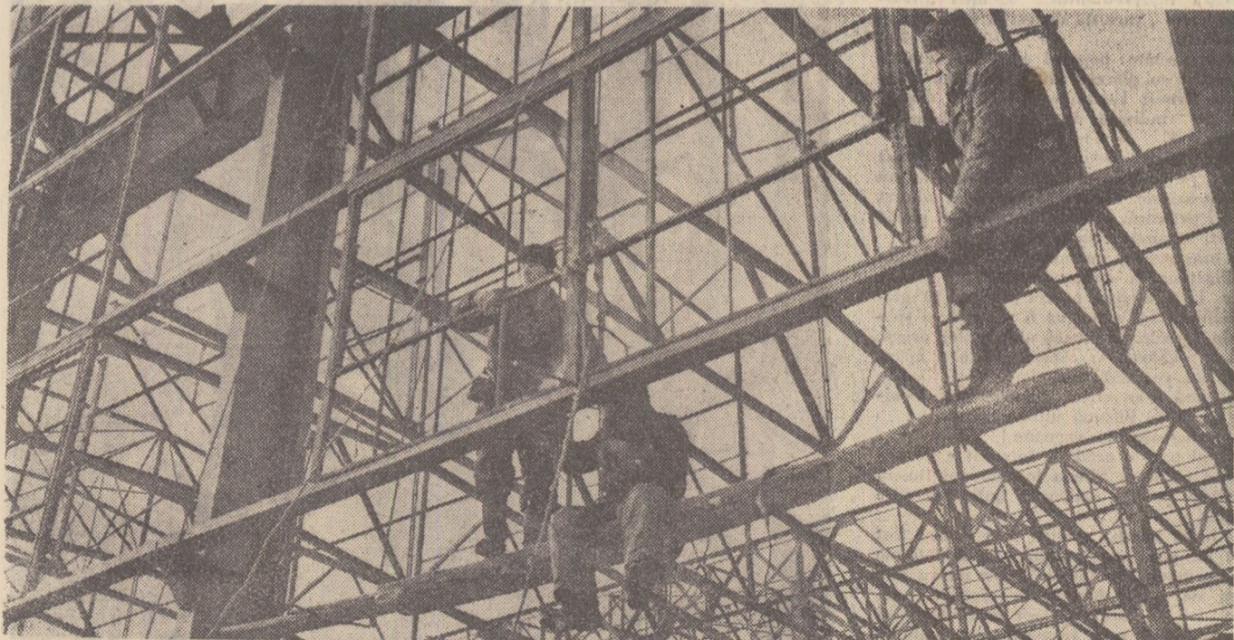
La Lipetsk se construiește o nouă hală pentru laminarea la rece.

Bateria centrală de cazane a aeroportului din Habarovsk are un coș de cărămidă înalt de 30 metri. Deasupra lui urma să se fixeze un grătar, în greutate de 880 kilograme. În mod obișnuit, montorii efectuau această operație în circa o lună de zile. La Habarovsk s-a folosit însă un procedeu nou de lucru: grătarul a fost instalat cu ajutorul elicopterului „Mi-4” și toată operația a durat numai 20 de minute.