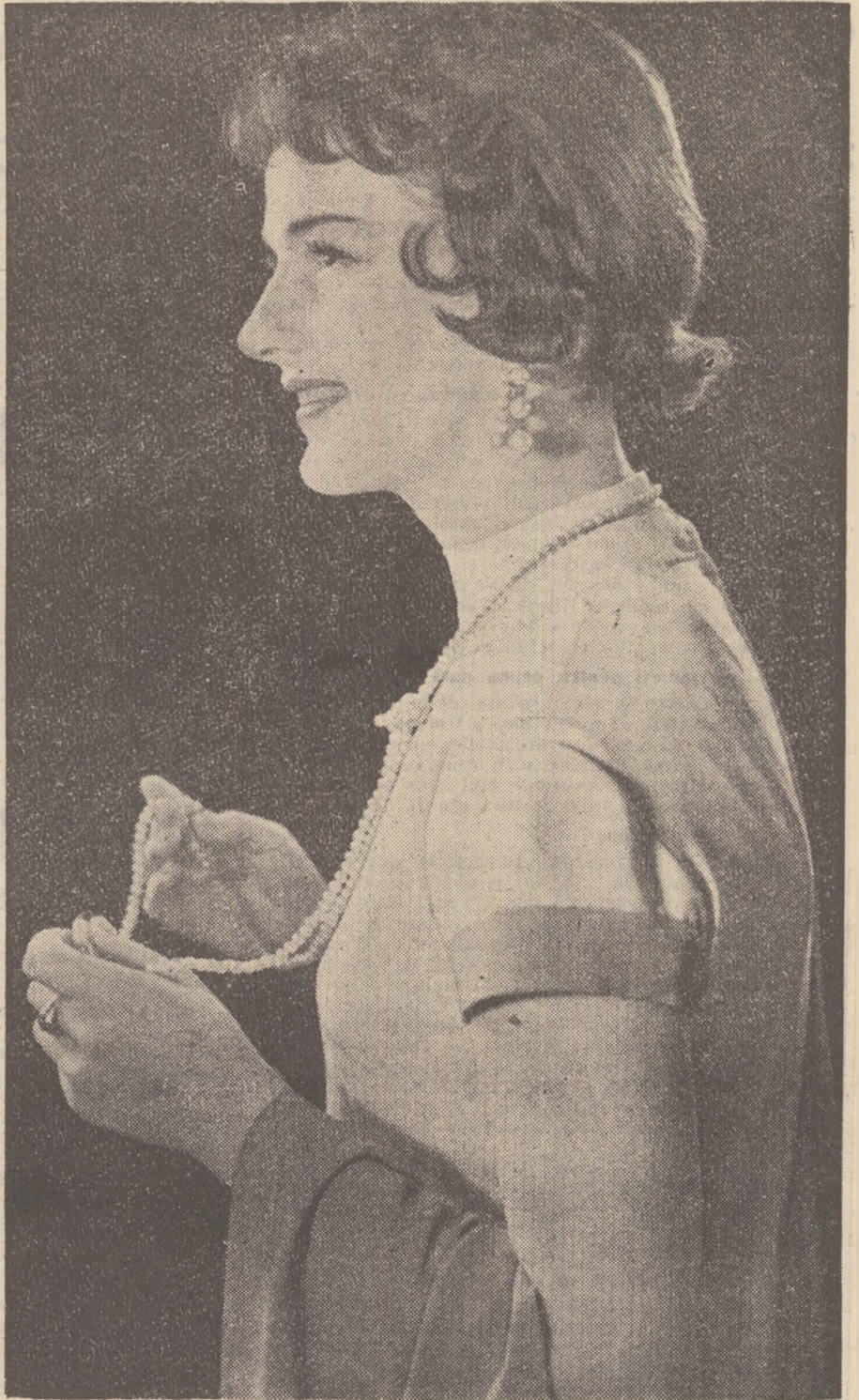
Actrița Iulia Borisova, de la teatrul „Vahtangov”