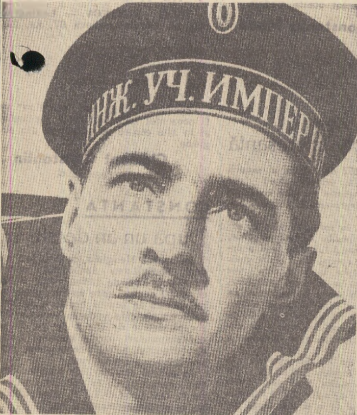
Actorul Viaceslav Tihonov în rolul micimanului Panin.

La Roma s-a încheiat festivalul filmului documentar sovietic, la care au fost prezentate zece filme, printre care: „Astronauții patrupezi”, „Cuceritorii mării”, „Atomul ne ajută”, „Poveste despre pinguin”, „Maeștrii baletului rus” ș.a.