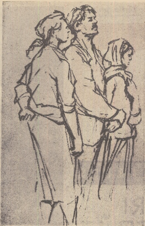
Ilustrație la „Rădăcinile sînt amare”.

— Ați urmărit, probabil, în presă seria de articole ale lui Ilya Ehrenburg despre educația