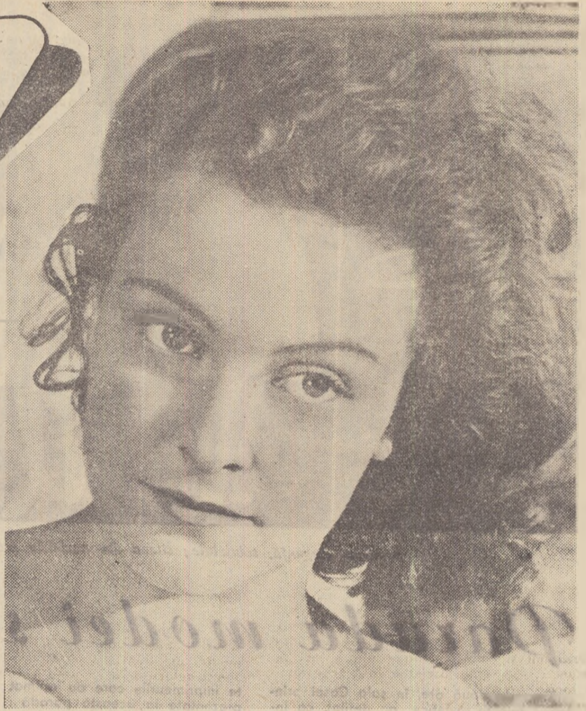
Actrița Tatiana Pilețkaia, una dintre stelele ecranului sovietic

interes, scriind mult despre vizita noastră. Un reporter a consacrat un articol special Elinei Bistrițkaia. Descriindu-i calitățile artistice, înfățișarea și îmbrăcămintea, autorul și-a intitulat articolul: „Knock-out actrițelor Hollywood-ului”.