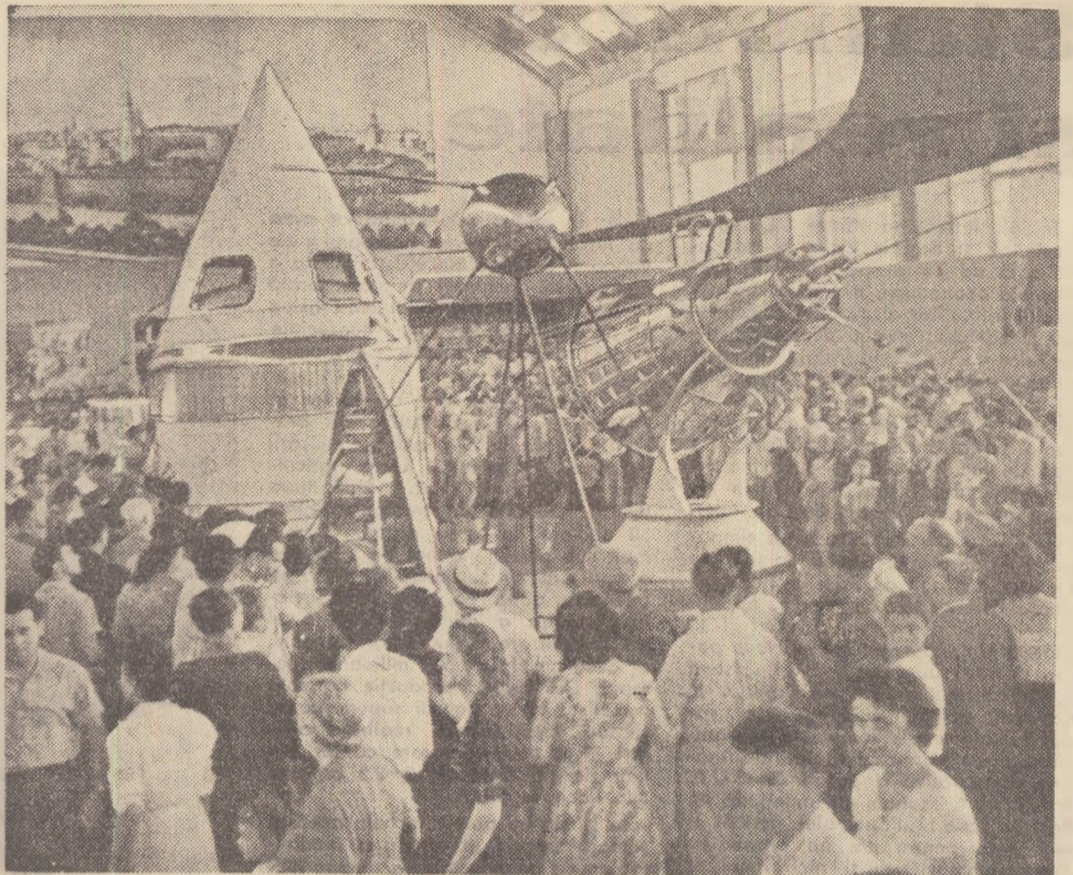
Mașinutele sputnicilor și a rachetei cosmice sovietice atrag mulți de vizitatori.