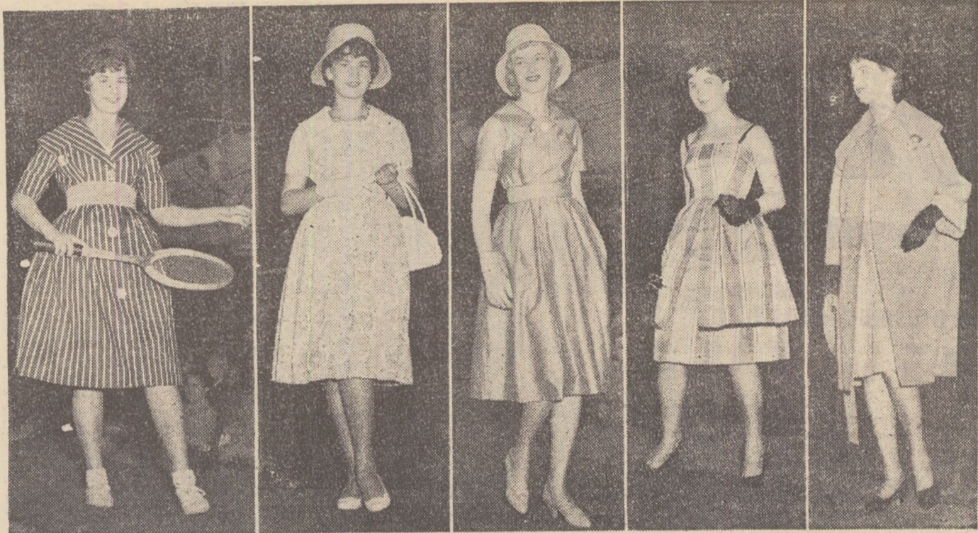
Armonie, eleganță, sobrietate; câteva din modelele prezentate la Casa Prieteniei.