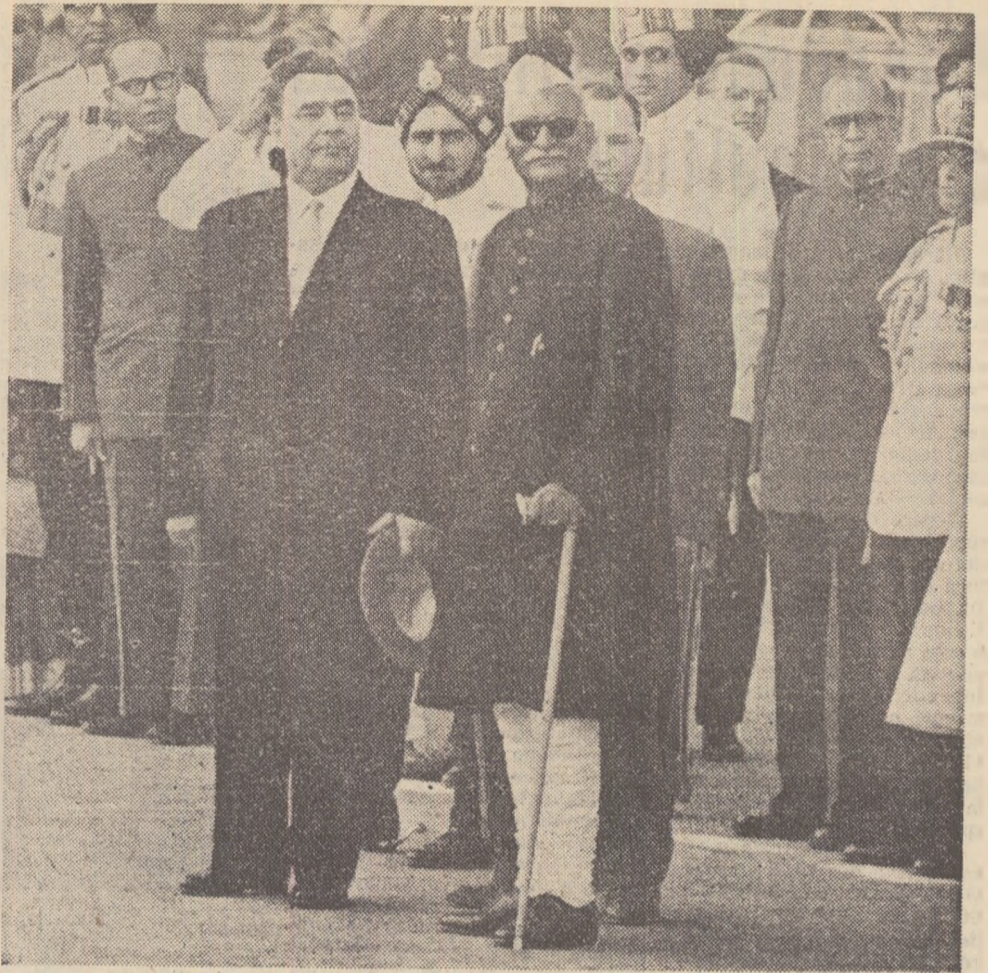
Rajendra Prasad, președintele Indiei, vizitează Uniunea Sovietică. În clișeu: Leonid Brejnev, președintele Sovietului Suprem al U.R.S.S., întîmpinîndu-l pe înălțul oaspete pe aeroportul Vnukovo.