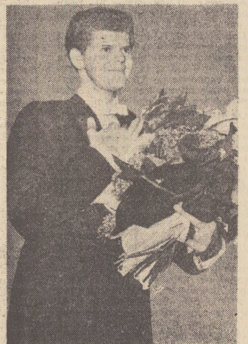
Pianistul american Van Cliburn, care concertează în U.R.S.S., mulțumind ovațiilor spectatorilor.

● Charles Percy Snow — socotit unul dintre cei mai mari scriitori contemporani englezi — care vizitează Uniunea Sovietică împreună cu soția sa Pamela Hansford Johnson, a declarat unui reporter de la „Literaturnaia gazeta”: „Am citit operele lui Șolohov, Panova, Fedin, Simonov, Polevoi, Leonov, Panfiorov, Paustovski și mulți alții. După părerea mea cele mai bune trăsături ale literaturii dv. sînt exprimate mai cu seamă în creația lui Șolohov, Fedin, Kataev și Leonov. Consider că mulți scriitori occidentali ar fi putut să învețe de la ei, încă acum 20 de ani, arta de a vedea și zugrăvi lumea. Am o foarte mare admirație și simpatie pentru opera lui Șolohov, pe care îl socotesc unul dintre cei mai mari scriitori ai lumii”