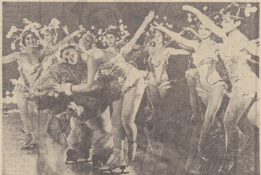
O scenă din „Fantezie de iarnă”

„Fantezie de iarnă” a cunoscut un succes răsunător. Pînă acum ansamblul a dat 200 de reprezentații, în fața a peste un milion de spectatori. În curînd, tînăra formație artistică sovietică va prezenta spectacole în alte orase ale Uniunii Sovietice și în străinătate.