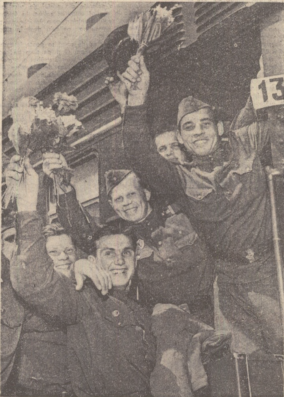
...Și ei vor construi combinatul metalurgic din Siberia apuseană...