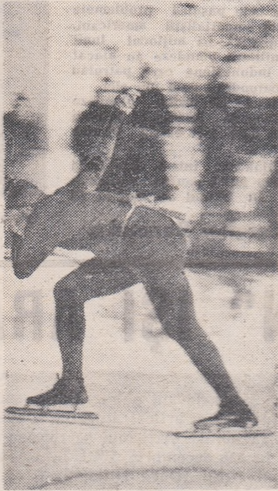
Evgheni Grișin — cel mai rapid patinator din lume. De mulți ani el este imbatabil în alergarea pe 500 metri, fiind deținătorul unui excepțional record mondial cu timpul de 39,6 secunde.

La Moscova va ieși pe gheață Viktor Kosicikin, complet restabilit. S-a pus pe picioare și Boris Stenin, care a mai fost campion al lumii și are deci „experiența” victoriilor mari. Francezul Kourprianoff a promis încă de la Oslo că va face tot posibilul să fie, în sfîrșit, primul. Ard de nerăbdarea revanșei Van der Grift și Knut Johannesen. Într-adevăr, com-