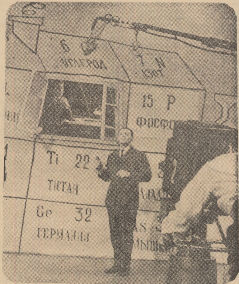
Din „cer“ a coborît o casă originală — tabloul lui Mendeleev. Cine „vede“ mai multă chimie?

ție a cunoștințelor și umorului, a istețimii și îndrăzneții, a spontaneității și bunului gust și, bine înțeles, a prieteniei și veseliei. Aici este strict interzis accesul plictiselii și al proastei dispoziții. Una din calitățile principale ale C.V.I. e caracterul lui de masă. La această folositoare „gimnastică a minții“ iau parte, practic, mii de tineri din multe orașe ale Uniunii Sovietice.