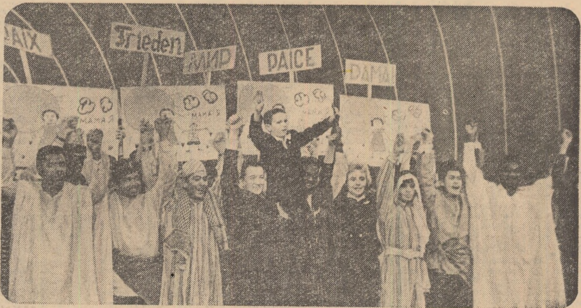
Fie-ntotdeauna soare, fie-ntotdeauna pace...