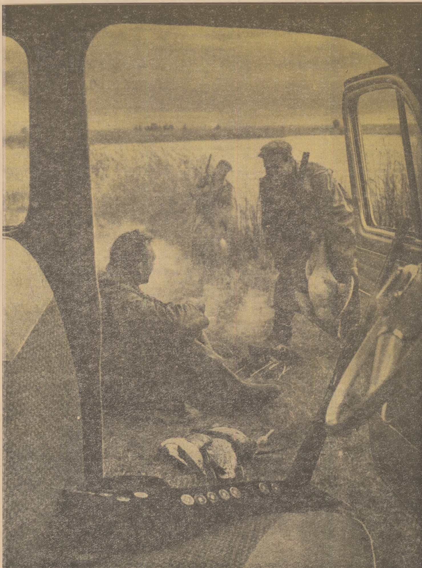
Vînătoarea a fost rodnică