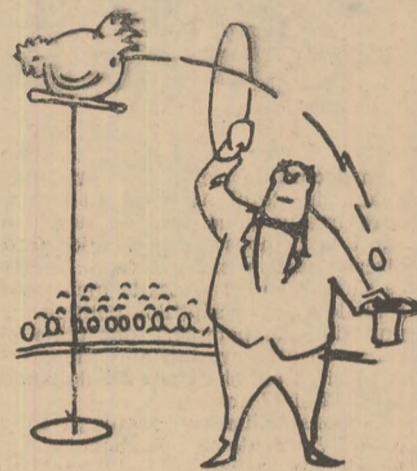
Minunile dresajului (Din Sovetski Tîre)