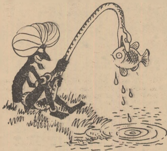
Jonglerie de primăvară