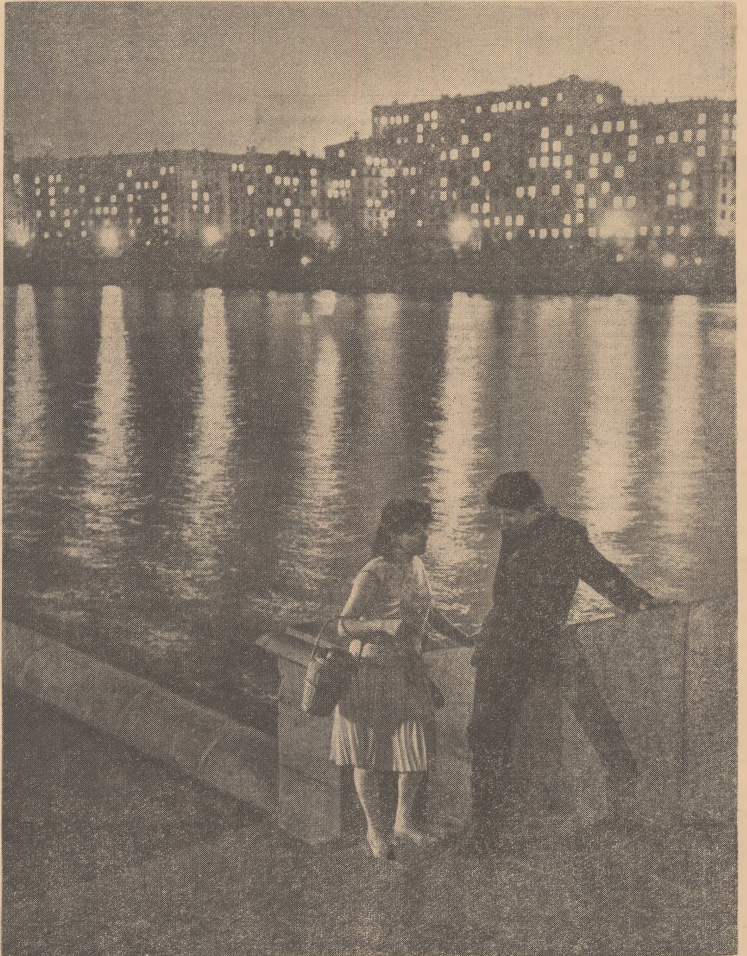
Primăvara, pe cheiul Moscovei