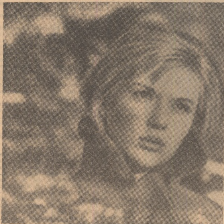
Galea Polskih, cunoscută spectatorilor noștri din filmul „Dingo, cîinele sălbatic” este protagonista „Romanței moscovite” filmul tineresc și optimist care a dobîndit una din distincțiile juriului la recentul Festival cinematografic internațional de la Cannes.