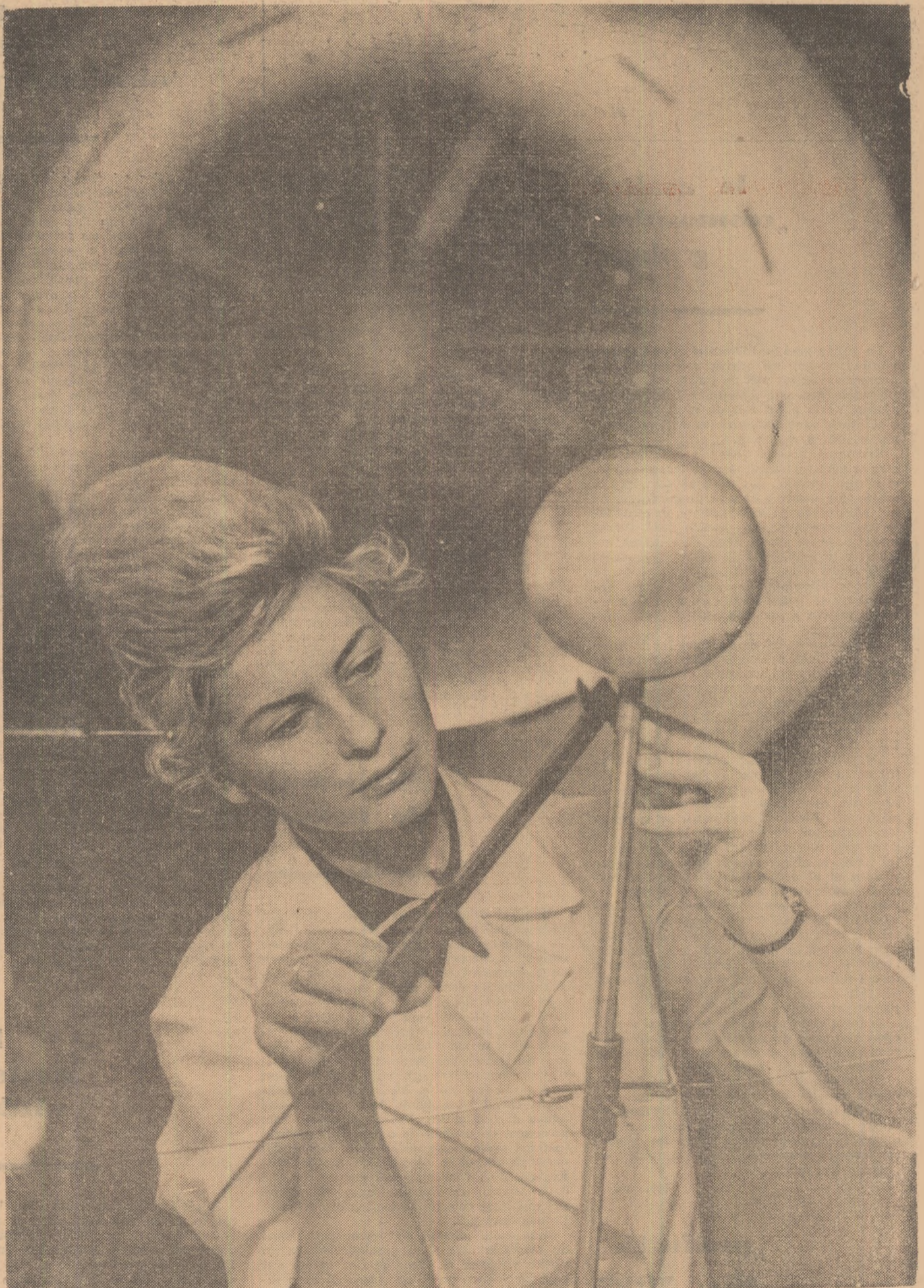
Farmecul tehnicii și al tinereții