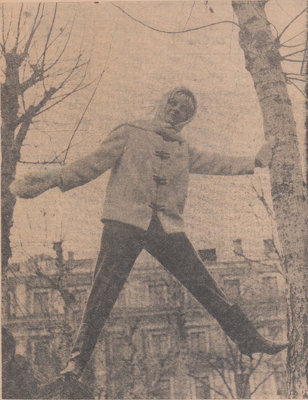
Costumul e gata, munții ne așteaptă... (Citiți în pag. 12-a „Cînd plecăm în excursie”)