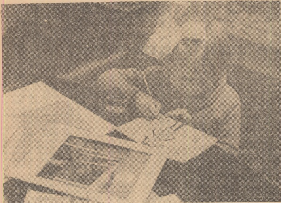
Autoportret semnat Rila