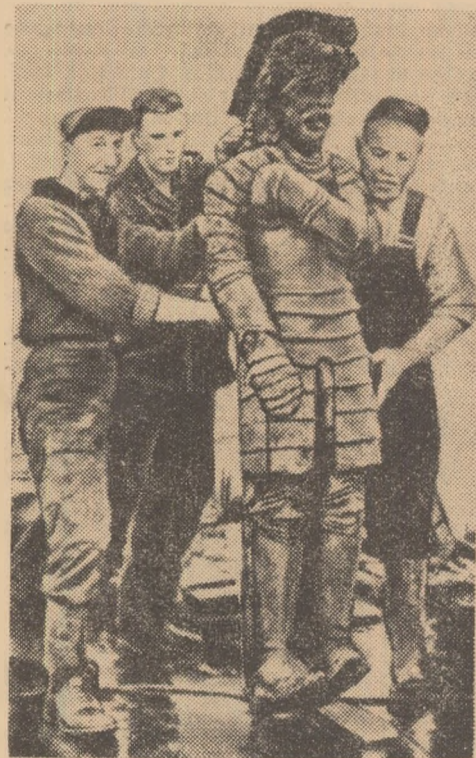
Cavalerul de lemn a văzut lumina zilei după trei secole de beznă.

Le-au trebuit cinci ani de muncă încordată pentru a readuce la lumina zilei, de la o adîncime de 32 de metri, cele aproape o mie de tone cit cîntărea „Vasa”. La 24 aprilie 1961, cînd mult așteptata fregată a răsărit din valuri, în fața miilor de oameni care o așteptau și-a făcut apariția un adevărat muzeu de sculptură în lemn: un uriaș inger cu aripile întinse și un minus-