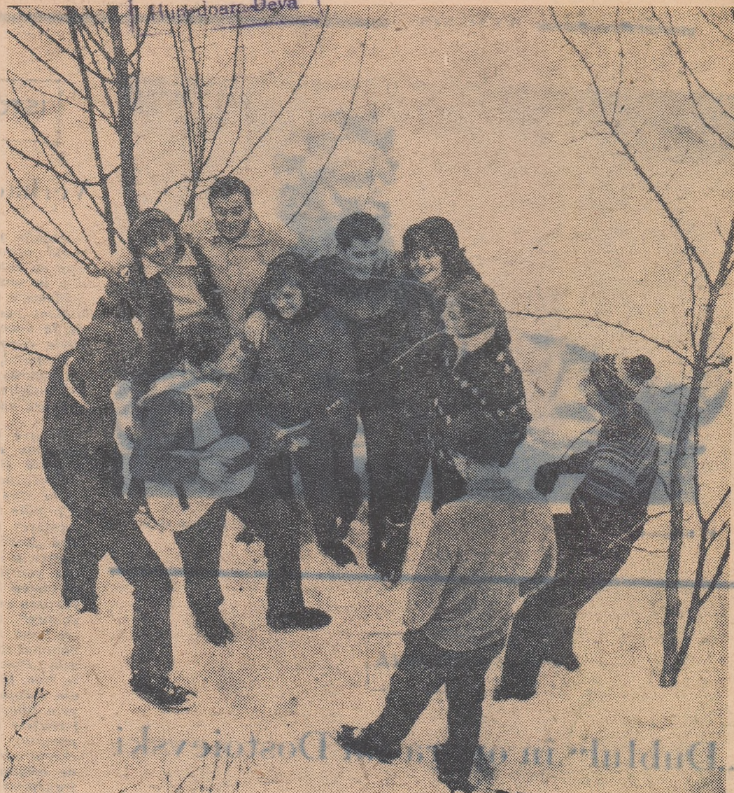
Același anotimp, peisaje diferite: în împrejurimile Moscovei...