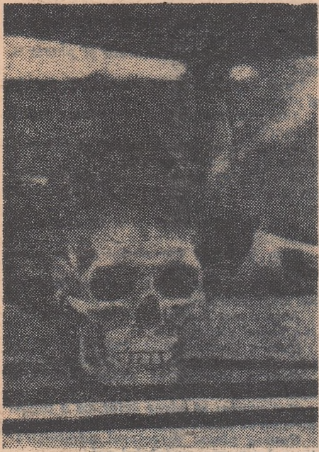
Pentru a-l intimida nu pe pietoni, ci pe conducătorii mașinilor din urma lui, un șofer a plasat acest avertisment la geamul din spate.

Fără îndoială că această din urmă recomandare este o simplă glumă. În ea se poate remarcă, însă, un grăunte din resentimentul omului de la volan față de omul ce folosește pentru deplasările sale numai cele două membre inferioare cu care l-a înzestrat natura. Încă de la Ilf și Petrov citire știm că