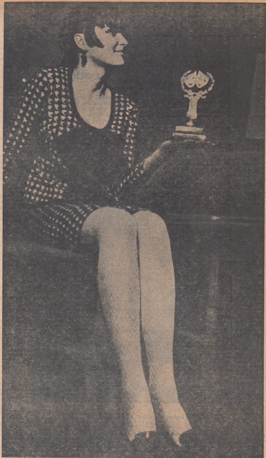
Marianna Vertinskaia ne vizitează țara cu prilejul Săptămîinii filmului sovietic (Citiți în pag. 3-a: „Destinul unor surori“)