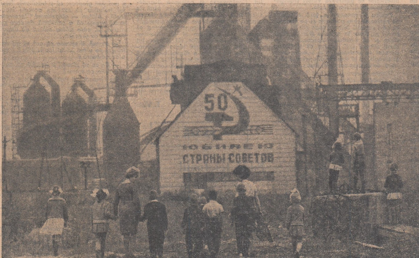
Tînăra generație a Novokuznețkului face cunoștință cu realizările generației vîrstnice