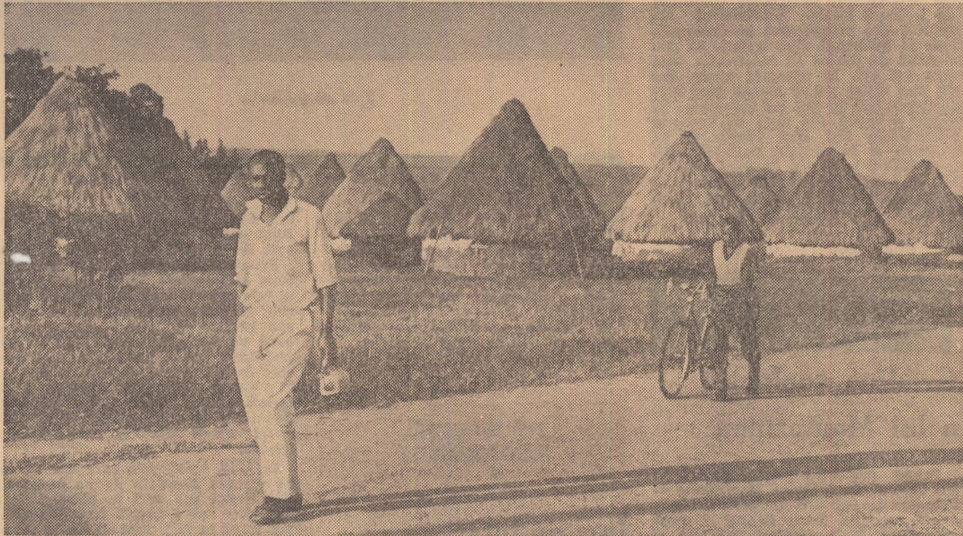
Contrastele satelor africane de astăzi...

Pentru oamenii de știință e și acum o enigmă întrebarea: cum, cînd și de unde au venit oamenii în această insulă? Un lucru e însă sigur și anume că s-au ivit acolo cu multe secole înainte de venirea europenilor în Oceania. Mica fișie de uscat a fost descoperită în 1797 de căpitanul englez Wilson. Cu prilejul călătoriei sale în jurul globului, în Ifaluk a poposit și navigatorul rus F. P. Litke care a trecut insulița pe hartă, stabilindu-i coordonatele geografice. Microscopicul atol a fost stăpînit de spanioli și germani, apoi de japonezi și americani, ultimii tutelîndu-l și în momentul de față.