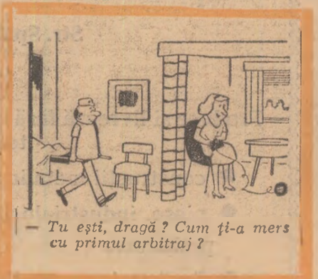
— Tu ești, dragă? Cum ți-a mers cu primul arbitraj?

Cu toții, sau în orice caz foarte mulți, iubim fotbalul și pe fotbaliști, vedete incontestabile ale vremii noastre, ne place să palpităm în tribune sau în fața televizoarelor, ne lăsăm furia de spectacolul fotbalistic; dar să nu facem din asta conținutul principal al vieții noastre, o prismă prin care să privim lumea. Sînteți de acord?