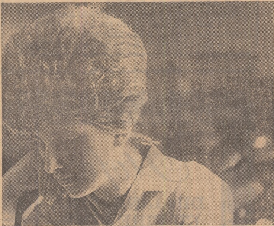
E deajuns să citești ca să devii intelectual?...