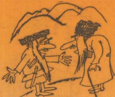
— Nu ne-am văzut de 100 de ani! Desen de V. Șkarban

cursa a fost cîștigată de bătrînul Habib, în vîrstă de 93 de ani, un foarte bun alergător. După părerea consătenilor lui. Anul acesta însă el n-a luat parte la întreceri. Abia se căsătorise și voia să-și petreacă luna de miere lîngă soția lui.