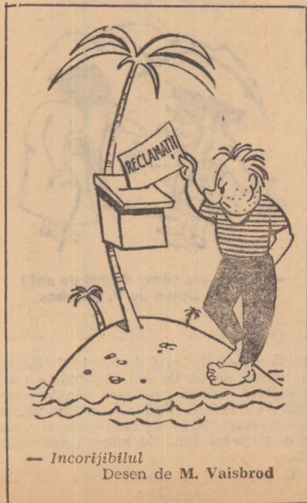
— Incorijibilul Desen de M. Vaisbrod

(După „Za rubejom”, „Nedelea”, „Izvestia”)