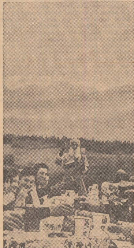
Un toast tradițional, rostit de nu mai puțin tradiționalul oaspete de onoare.

trei secunde, după care a fost întrecut de veteranul satului, un bătrîn de 104 ani. Cîștigătorului i s-a înmînat premiul tradițional, o piine cît roata carului; cei plasați pe locurile doi și trei au primit piini mai mici.