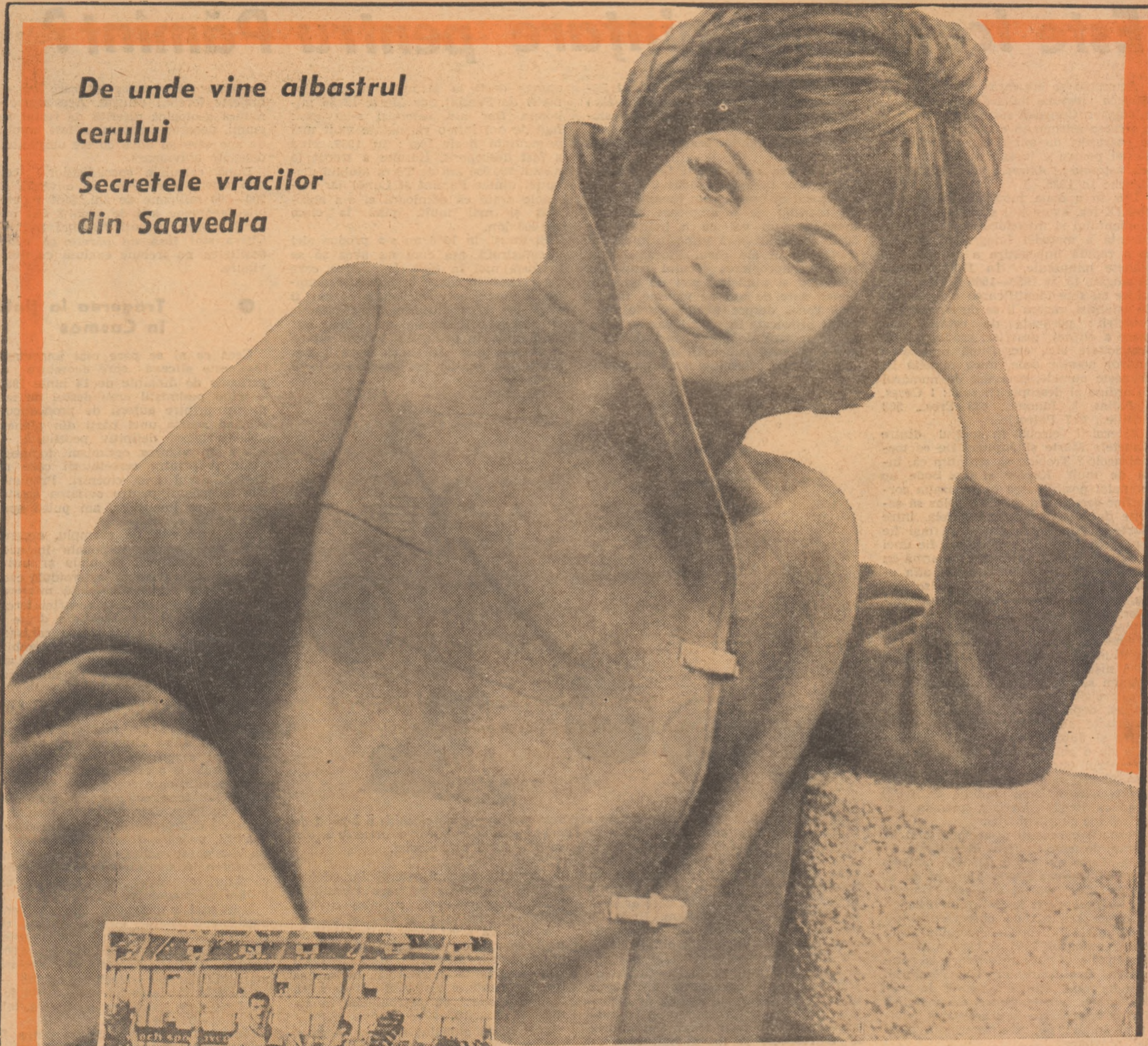
Actrița Valentina Maliavina