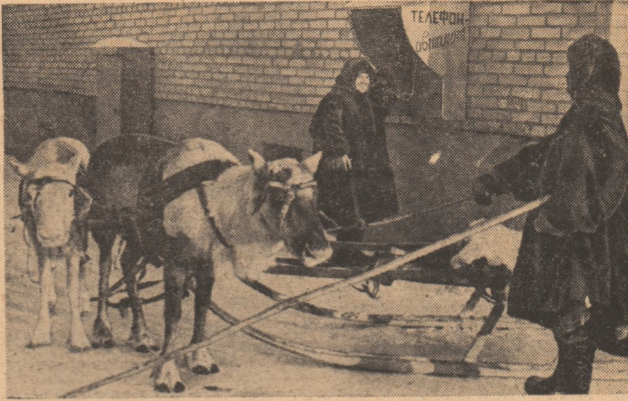
— Alo, ați primit hamuri pentru renii

Dar londonezii n-au putut renunța la fotbal. Și se spune că la un moment dat regele a socotit că-i mai înțelept să nu observe pasiunea supușilor săi, pentru a nu trebui să întemnițeze trei sferturi din populația regatului. Urmașul lui, Eduard al III-lea, n-a mai recurs la măsuri drastice. În schimb s-a plîns că nu are destui arcași pentru a se război cu Franța. Regele vedea o legătură directă între lipsa de arcași și fotbal: pasiunea pentru acest