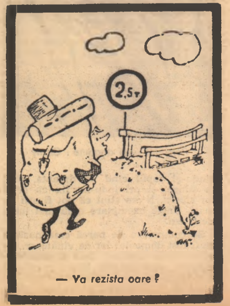
— Va rezista oare ?

globul globul globul globul globul globul globul globul globul globul globul globul globul globul globul globul globul globul globul globul globul globul globul globul globul globul globul globul globul globul globul globul globul globul