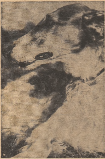
...și un campion al frumuseții canine, ogarul Terzai

strecoare prin ele cu agilitate. Laika mai au însă și o altă mare calitate. De obicei, ciinii de vînătoare se specializează în anumite operații: unii descoperă vinatul, alții îl prind sau îl aduc. Laika e un ciine universal. Știe să facă de toate. În plus, vinează cu aceeași dexteritate veverițe și rîși, cocoși de munte și cerbi, samuri și urși, ba nu se dă în lături să lupte corp la corp cu un animal atît de fioros cum e rossomaha siberiană. Conștient, însă, de fiecare dată, de raportul de forțe dintre el și vînat, ciinele folosește mereu metode adecuate, care variază între atacul direct și viclenie.