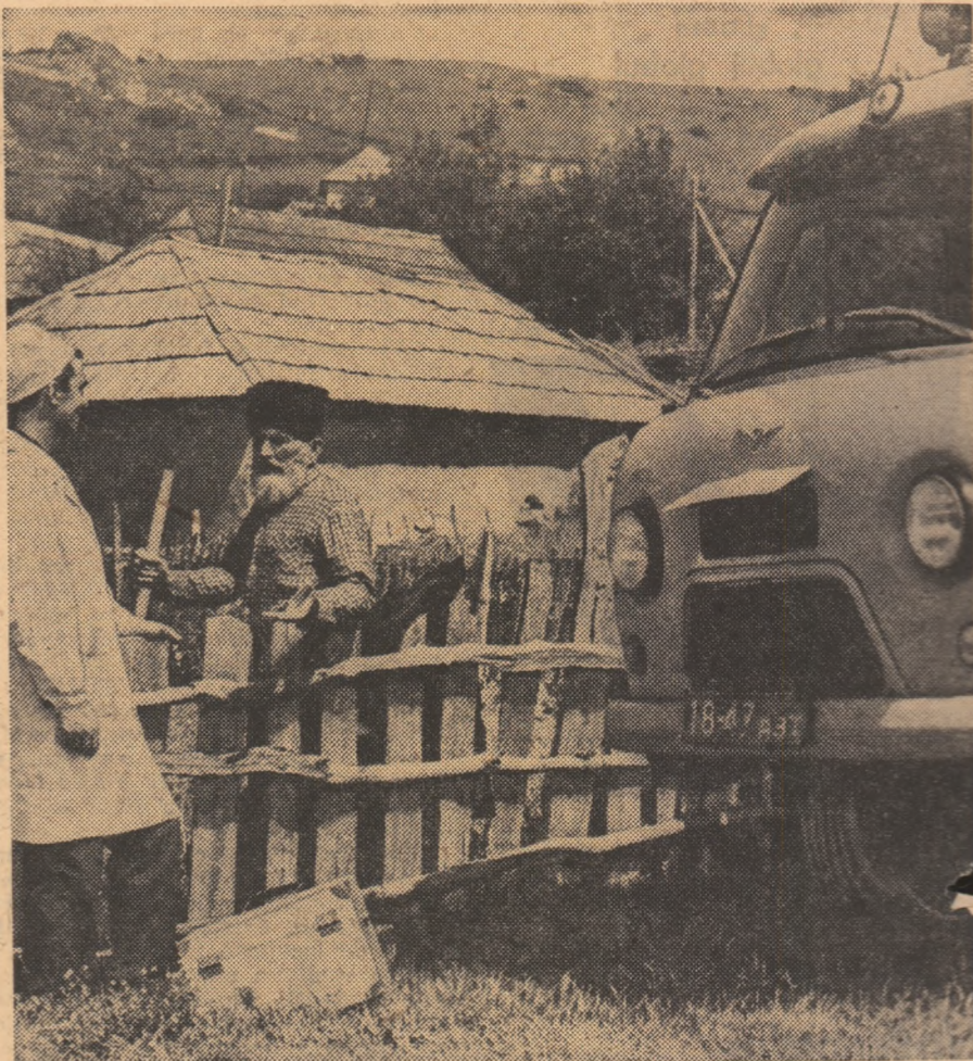
A 165-a primăvară a longevivului gruzin Sıralı Musımov

De o rară frumusețe și finețe este miniatura intitulată „Dans polonez” de Oghinski: o crizantemă minusculă cu 99 de petale și o frunză, și ea microscopice, alcătuesc portativul și notele acestei piese muzicale (în total — 600 de note).