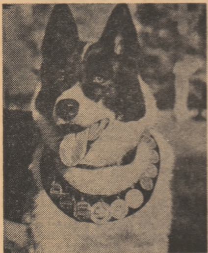
Urman, multiplul campion al rasei laika

La Asociația vinătorilor din U.R.S.S. sînt înregistrați peste 200 000 de ciini de vînătoare de diferite rase. Dacă odinioară cel mai solicitat ciine de vînătoare era ogarul rusesc cunoscut sub denumirea de borzoi , acum el a cedat locul reprezentanților rasei laika . Cele patru variante ale rasei de ciini de vînătoare laika au aceleași caracteristici: curaj, rezistență, devotament. Ciinii laika nu se tem de gerurile năpraznice, căci sînt „înveșmîntați” într-o blană călduroasă, nici de zăpadă adîncă căci au labelle destul de mari și de late, nici de desigurile pădurilor, căci statura lor moderată le permite să se