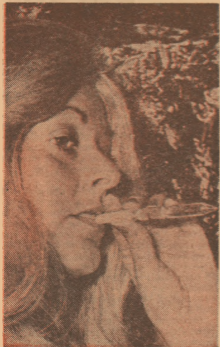
Mic tub de testare a concentrației alcoolului în sînge, inventat pentru ca conducătorii auto să se controleze singuri dacă se pot urca la volan.

Ce s-ar putea face pentru a pune capăt acestui flagel modern? În primul rînd specialiștii din toate țările ar trebui să se pună de acord asupra dozei limită de alcool din sînge, dincolo de care e imprudent a pune mîna pe volan. Într-adevăr, actualmente această doză variază, după țară, între 0,30 și 1,50 g de alcool la litru de sînge. Diferențele, considerabile, se datoresc faptului că oamenii nu reacționează în același fel la aceeași cantitate de alcool. Cercetări îndelungate au dus în fine la certitudinea că o proporție de 0,50 g alcool în sînge, adică conținutul de alcool al unei ju-