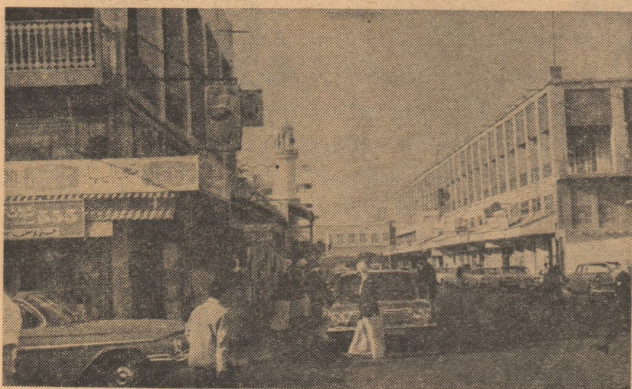
Centrul orașului Manama din Bahrein.