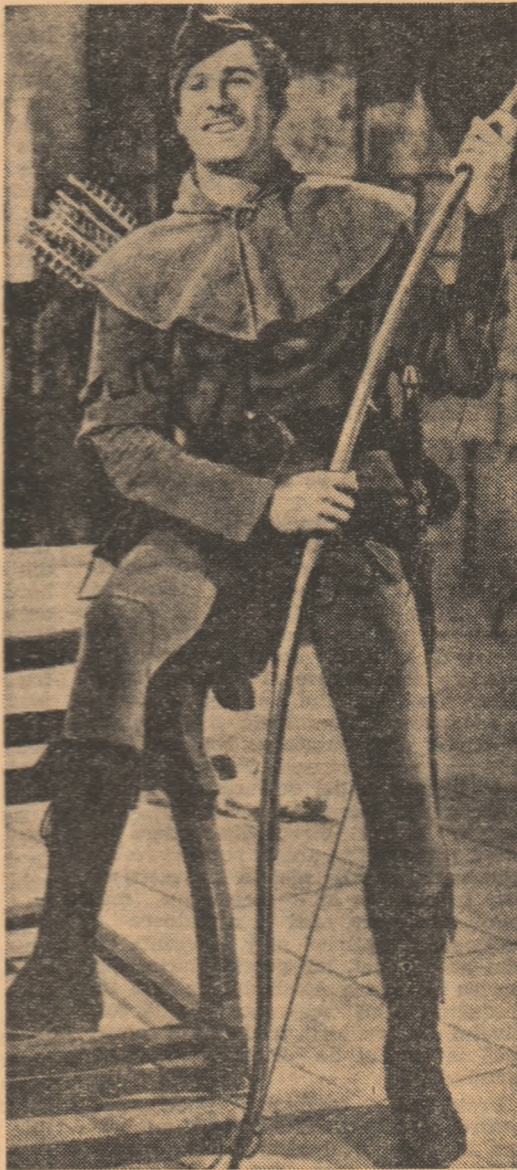
Robin Hood în interpretarea lui Errol Flynn.

Nu există dovezi că unii dintre ei s-ar fi ascuns chiar în pădurile din Sherwood și că și-ar fi instalat statul major sub stejar. Dar cu timpul povestea acestor oameni, episoade reale și inven-