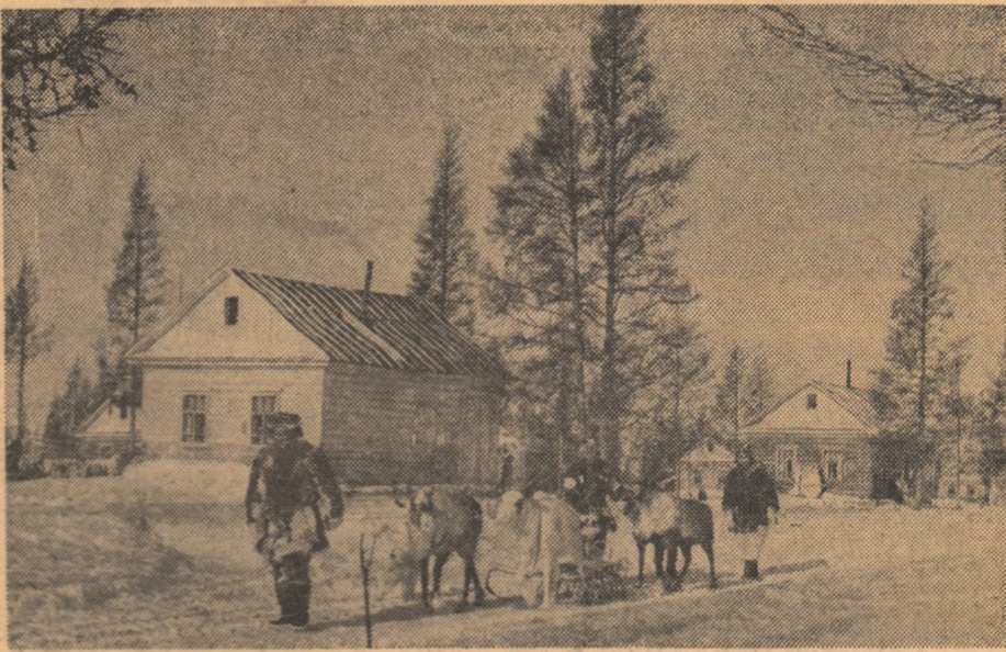
Kamceatka. Peisaj tipic.

În afara lipsei unei unanimități de păreri asupra toleranței fiziologice, mai există însă și alți factori care întîrzie încheierea unui acord internațional asupra nivelului admisibil. Pe primul plan se situează vîrsta: doza de alcool care-l poate face pe un tînar de 17 ani să meargă pe trei cărări va influența prea puțin un bărbat de 45 ani. După cum nu este indiferentă starea sănătății și intervalul în care este bătută o cantitate de alcool. Astfel, 4 pahare dintr-o băutură tare au un efect mai puternic dacă sînt date pe gît într-o jumătate de oră decît dacă sînt absorbite în 4 ore. Pe de altă parte, starea de beție se modifică în timp; în primele două ore se accentuează, pentru ca după aceea reflexele să se normalizeze de la sine; or, în general acest fenomen este mai rapid decît scăderea alcoolului din sînge.