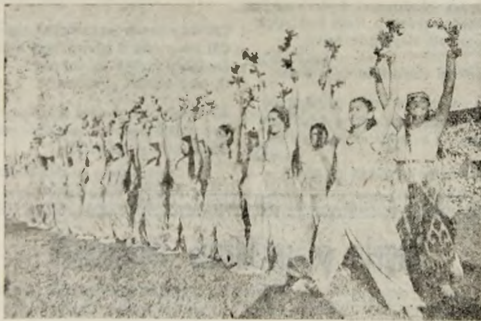
Un grup de tinere fete din Republica Sovietică Tadjikistan de ziua sporturilor la Moscova

În Germania fascistă este exact contrariul: vedem acolo femeia lipsită de toate drepturile, asuprită, transformată într-o „mașină de făcut copii”. Înainte ca nazii să ia puterea erau prezente în Reichstag mai multe femei. Dar acești barbari socotesc că femeile n'au ce căuta în viața politică și socială a țării: Hitler a declarat că „prezența unei femei în Reichstag ar fi necinste pentru acesta”. De asemenea nu se vede nici un nume de femeie pe listele electorale în momentul preținșelor „alegeri”.