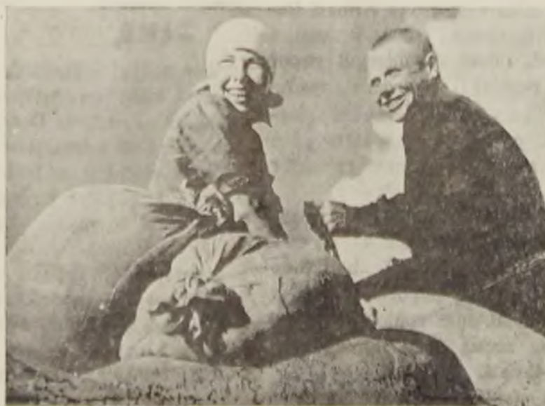
După muncă... și răsplăt