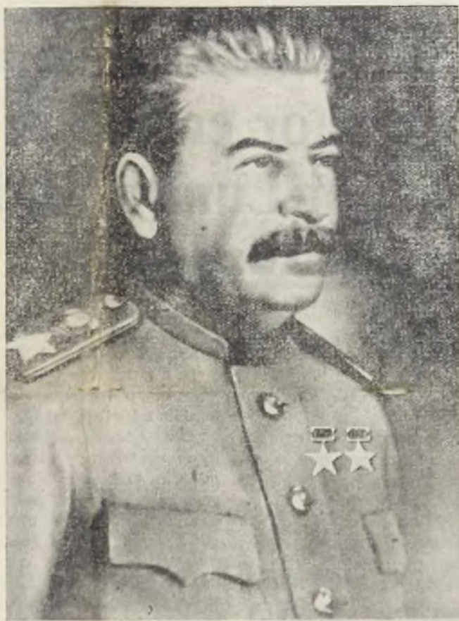
Generalissimo STALIN — făuritorul victoriei —

sânge și barbarii din cele mai crude, săvârșite de imperialismul fascist victoria deplină a popoa-