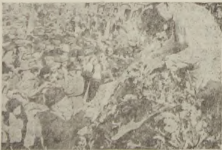
D. Primministru Dr. PETRU GROZA împărțind titlurile de proprietate țărănilor din județul Hunedoara