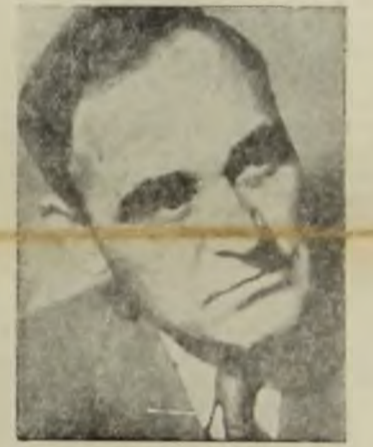
Gh. Gheorghiu-Dej într-o parte a gesea parte a globului parăntesc, în egalul unei ere noui în istoria omenirii, era revoluția proletară, era socialismul și comunismul.

Instaurarea unei noi ordini sociale, economice și politice, instaurarea puterii muncitorești în țară.