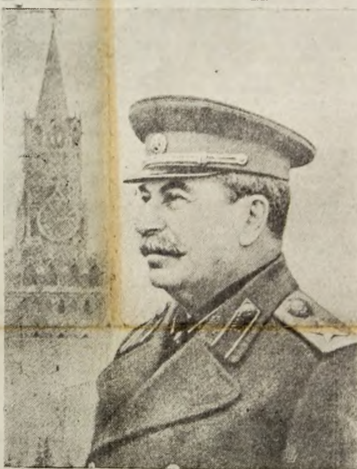
GENERALISSIMUL I. V. STALIN făuritorul victoriei asupra fascismului și conducătorul luptei pentru pace a popoarelor

ABONAMENTE: LUNAR lei 120 COLECTIVE lei 80 Individualitate pt. țărani, muncitori și învățători 100 lei Pe 3 LUNI lei 350