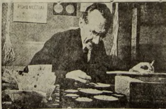
Selecionarea semințelor ocupă un loc de frunte în agrotehnica Sovietică. Savantul N. V. Rudnik, laureat al premiului Stalin, lucrează în laboratorul său agrotehnic din districtul Kirov