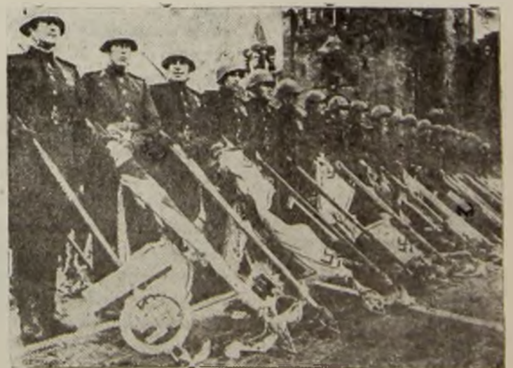
La 24 Iunie 1945 soldații Sovietici depun în fața marelui Lenin din Piața Roșie (Moscov) drapelul dăganului înfrânt