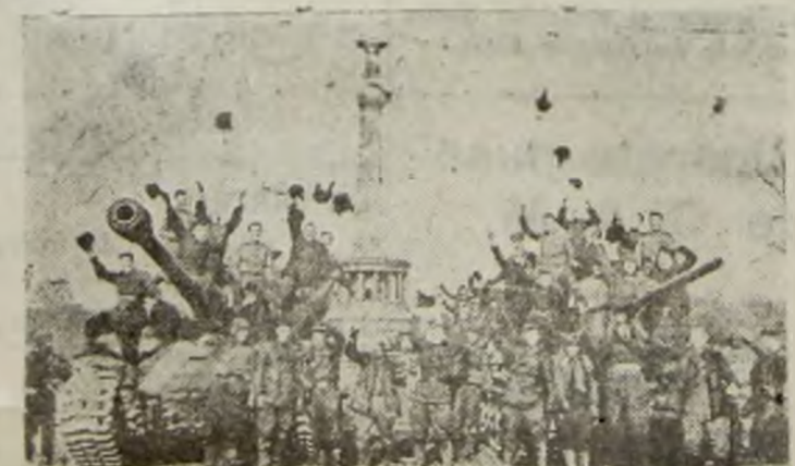
Berlinul, ultima fortăreață nazistă, a fost cucerită de trupele Sovietice