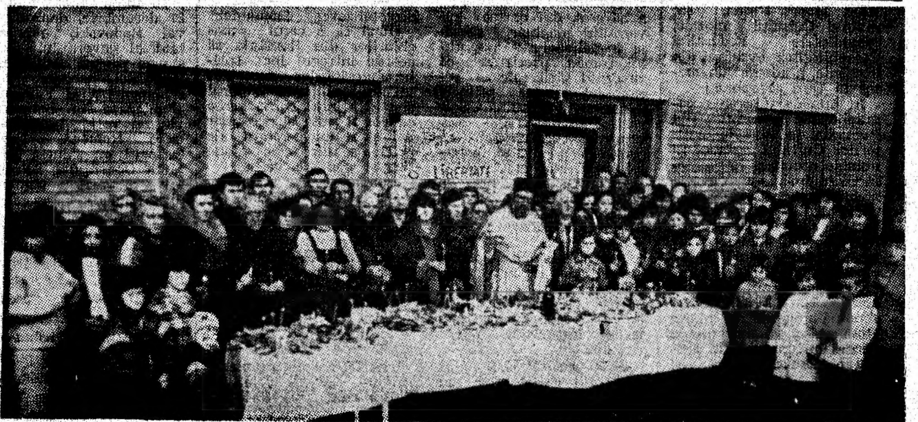
„Omăgiu eroilor căzuți pentru LIBERTATE“, adus de oamenii liberi, după obiceiurile strămoșești ale neamului nostru. În imagine, locatarii blocului 54, strada Aviatorilor din Petroșani.

Sinceritatea și simplitatea, vechi virtuți ale poporului nostru, au fost nu doar disprețuite ani în șir, ci înlocuite cu un gust al grandorii inutile. Nu trebuie să mergem în altă parte să observăm aceste monumentale și șovăitoare aberații. Un exemplu edificator este parcul din