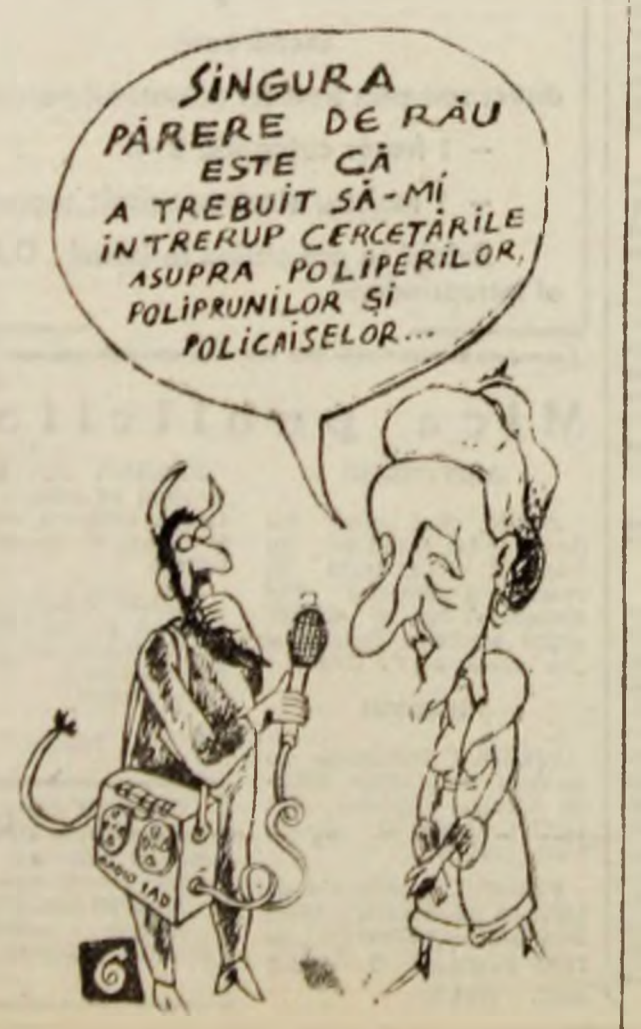
Caricatură de Ion BARBU