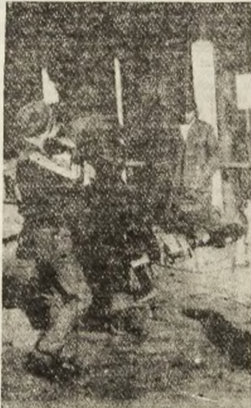
Cei care n-au ajuns la saci, nu cărat cu poala sau cu brațele. Să se aleagă cu ceva, nemernicii!