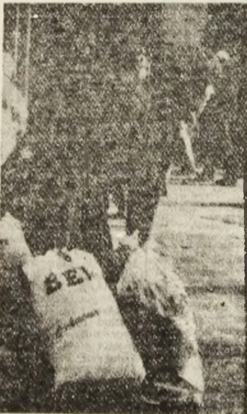
Furt ca-n codru, cu sacul, nu cu amănuntul.