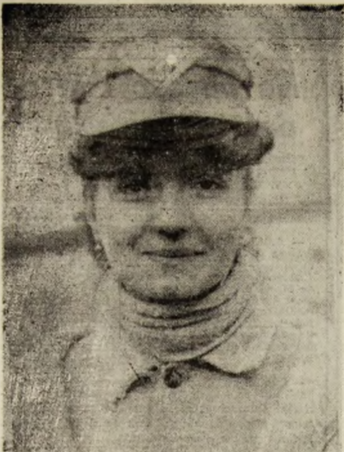
Zimbelul tinereții — un soare pe care îl poți privi.