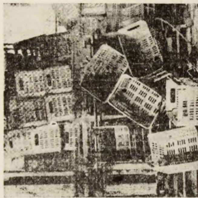
Ce înțelegeți din această dezordine? Aspect de la fabrica de pâine din Bărbănteni.