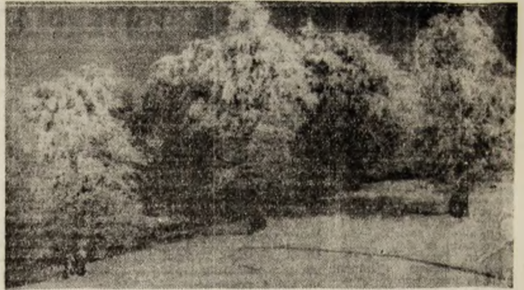
La altitudine, zăpezile își mai păstrează farmecul.

N. Red. Dorim să adaugăm, la aceste rînduri, convingerea noastră bazată pe cunoașterea probității medicilor și integrității colective al maternității din Lupeni — că în această unitate spitalicească îngrijirea acordată pacienților va fi mereu însoțită de omenie și bunăvoință. Cunoaștem, de asemenea, că în prezent tratamentul în spitale și policlinici se face cu mult efort, în ore îndelungate de muncă.