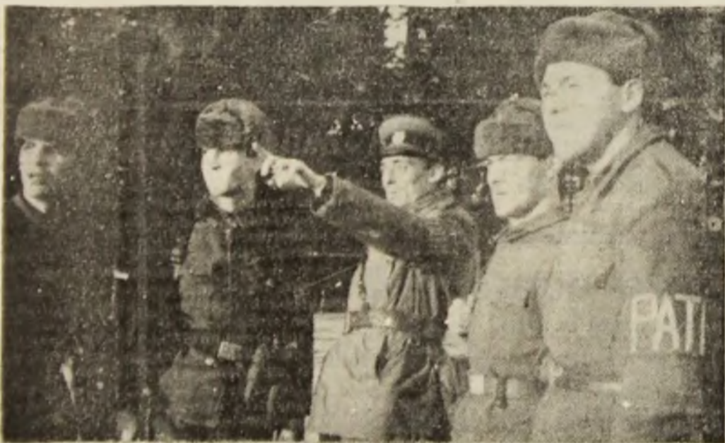
De veghe la liniștea urbei.