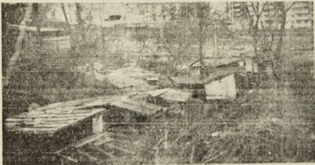
„Cătoru" din ultimii ani ai dictaturii: cotețe în care creșteau aproape de a valma porci, găini și găște pentru nevoile de hrană ale familiei.