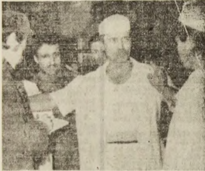
Și brutarii sînt nemulțumiți de piinea pe care ne-o dau nouă s-o mîncecăm.