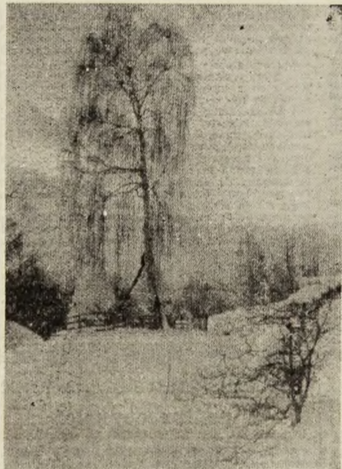
„Pastel de iarnă”.