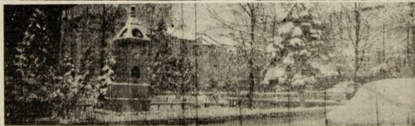
Lăna revine în actualitate. Deducem că cu lapoviță... și ploaie.