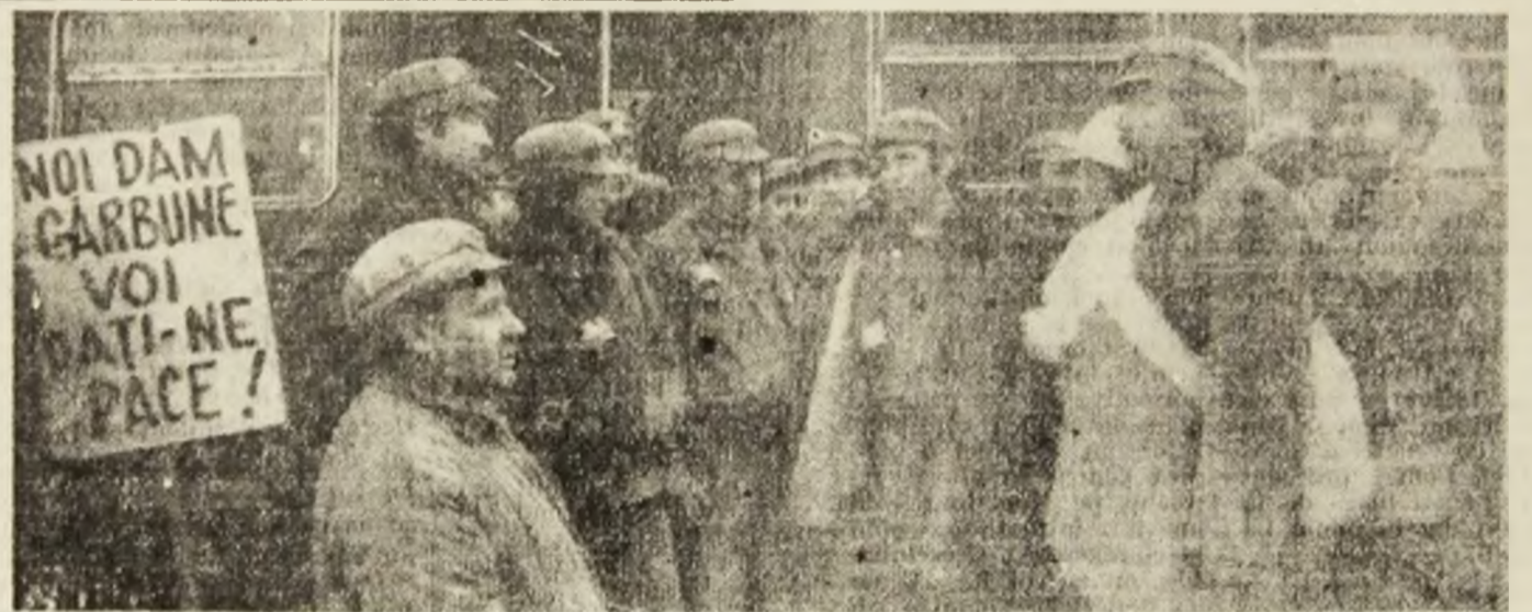
Gîndurile minerilor sînt îndreptate spre muncă, ei îi dezaprobă cu vehemență pe huliganii care încearcă să destabilizeze țara.