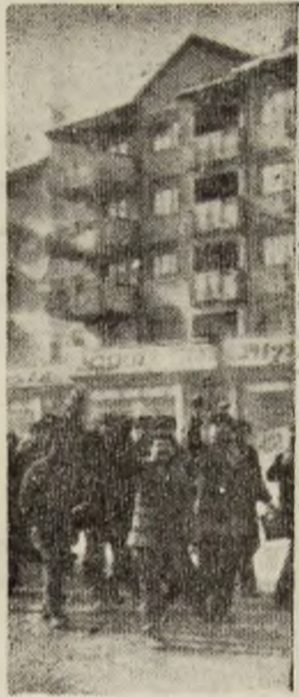
Ieri, în Petroșani, cald de manifestări de simpatie față de conducerea CPUN și a Guvernului țării.

N.R. Alte relatări, împreună cu imagini foto, în ziarul de mîine.