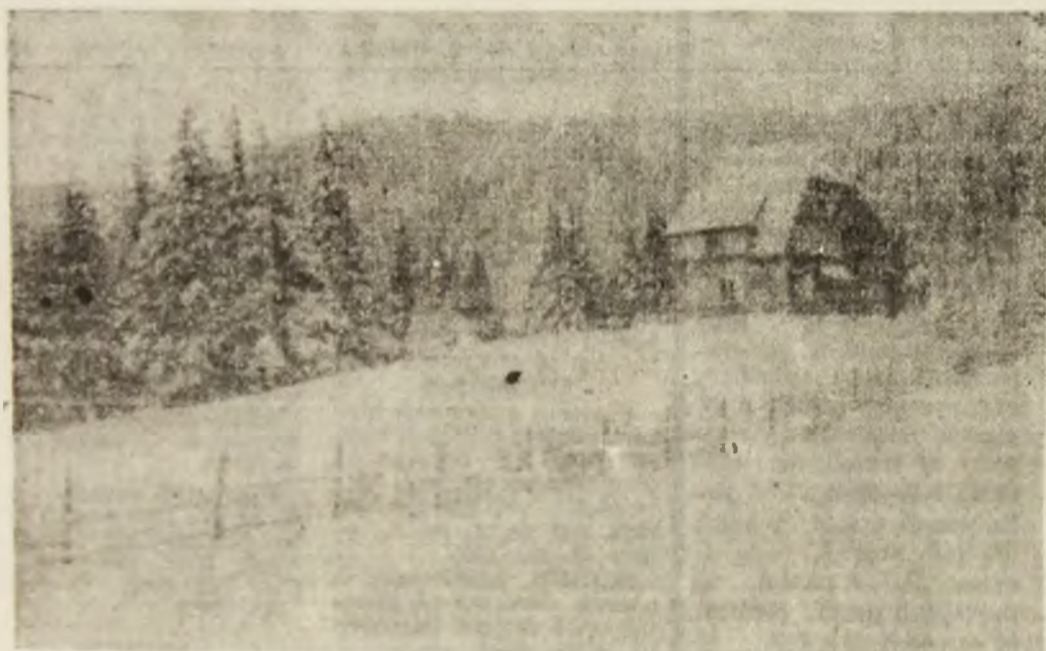
Pastel de iarnă.