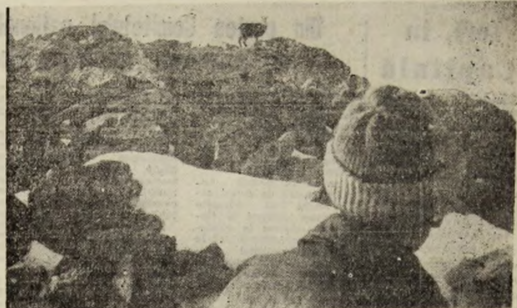
Monumente ale naturii.