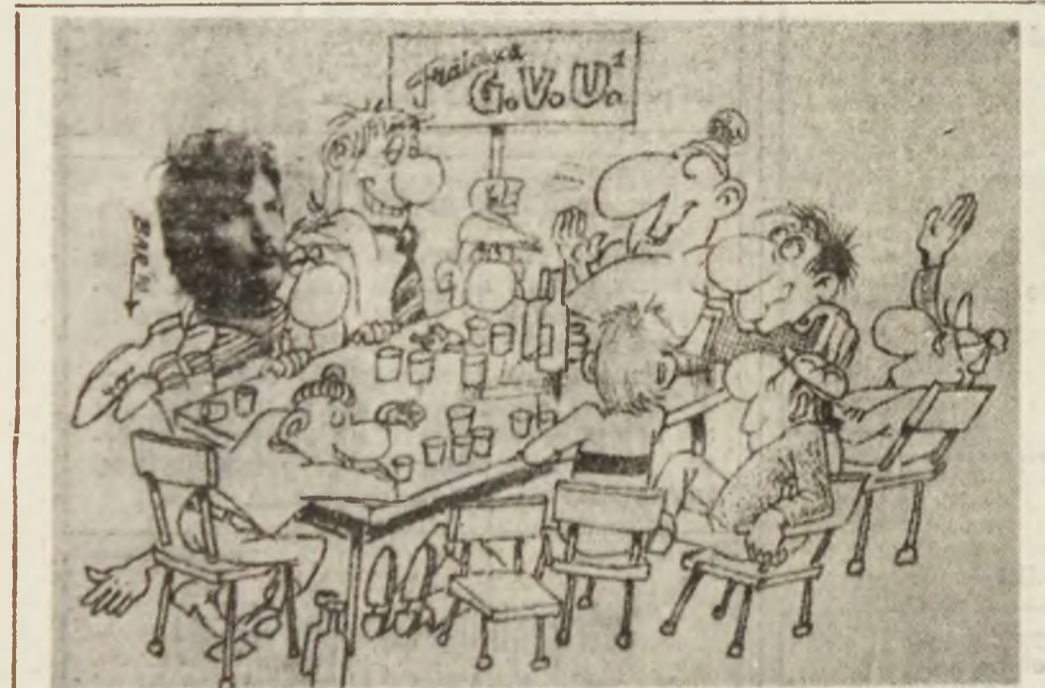
— Dacă revendicările noastre, nu vor fi soluționate pînă la ora închiderii vom intra în greva setei pînă miine la ora 10.

1) Pentru cine încă nu a auzit de acest partid: Gituri veșnic uscate.