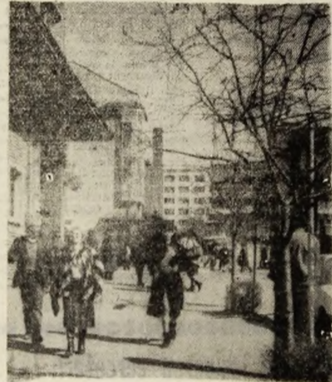
Petroșani. La pas cu primăvara.