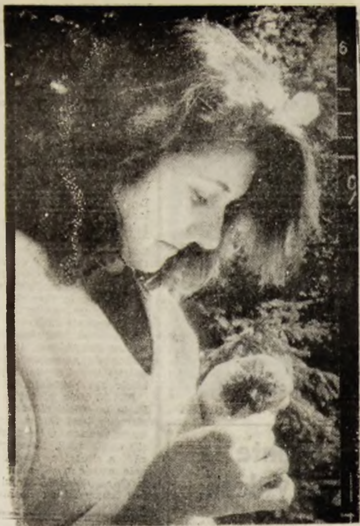
O floare privește o floare...