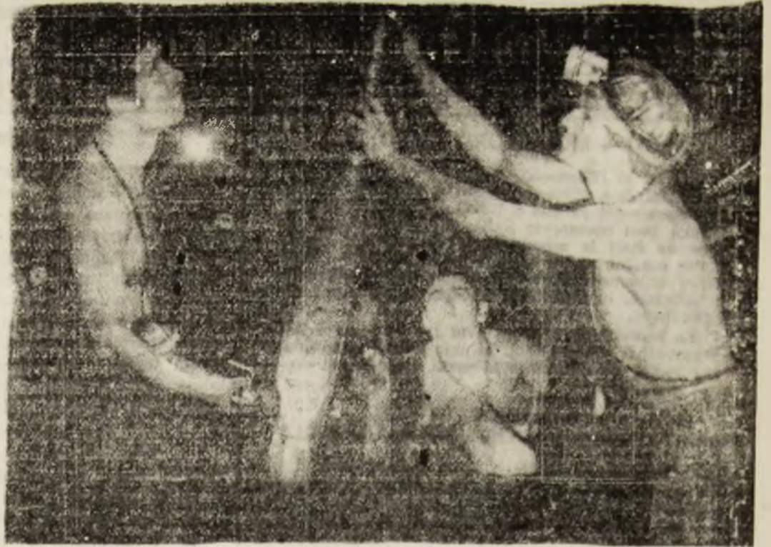
Mina înseamnă și dirzonie, dar și iscusință.

Dinamica producției din ultimul timp denotă că minerii Lupeniului au înțeles că, dincolo de politicianismul oratorilor infocați și al demonstranților „de fiecare zi”, că munca rămîne una din certitudinile uriașului demers constructiv pe care-l cere zidirea noului destin al țării.