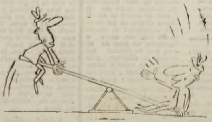
„Și cine spui că te-a ajutat să ajungi acolo sus?” Desen de Vali LOCOTA