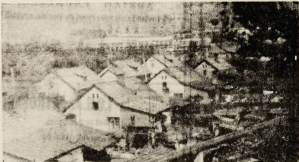
Privită de sus, colonia îndeamnă la nostalgie.

Să urîm succes echipei Minerul Uricani și să fim alături de ea, pentru a o ajuta să izbindească în această încercare foarte importantă pentru fotbalul din partea vestică a Văii Jiului. (G.C.)