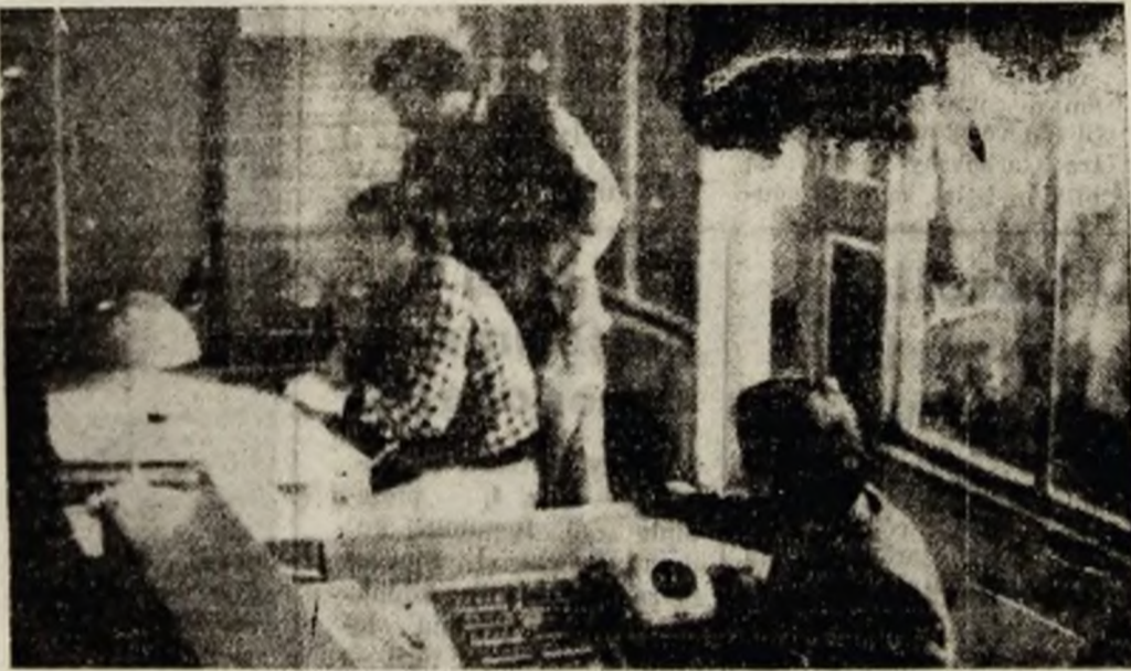
I.M. Livezeni. Dispeceratul.

numită zonă de recepție din Iseroni și Sașa. Programele de retransmisie radio și TV sînt automatizate. Nu au cum să fie întrerupte, deoarece beneficiază de o supraveghere permanentă”.