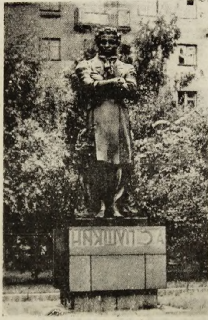
Statuia marelui poet rus A.S. Pușkin din Petrozavodsk.