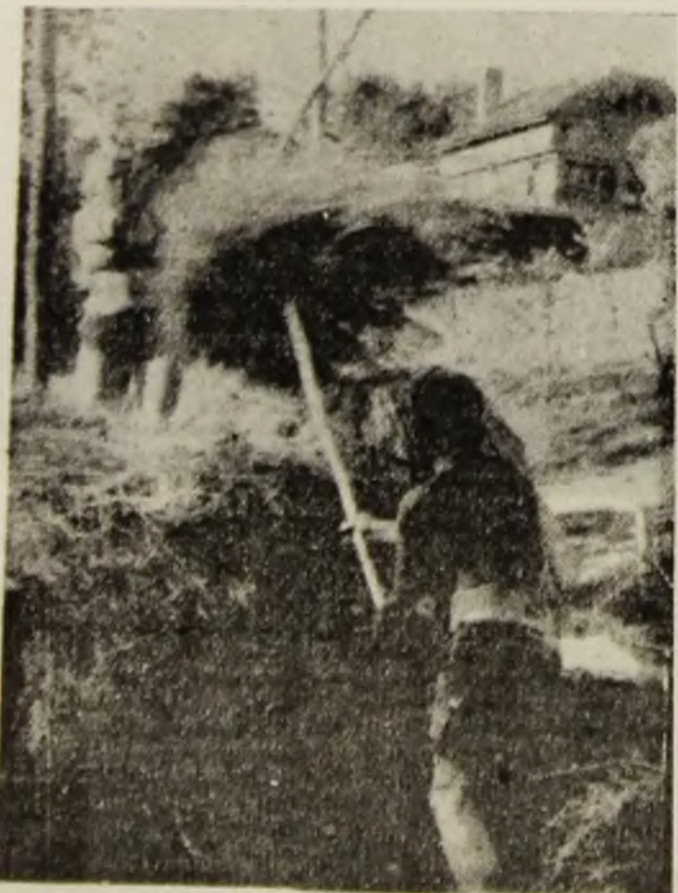
La clăditul finului.