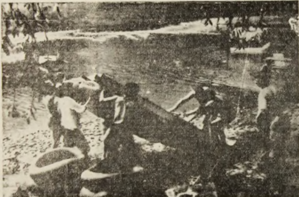
Pregătirea pentru lansarea la apă a ambarcațiunii lor.

După ce s-a chinuit atîta, pentru a promova în prima divizie de fotbal a țării, echipa feminină Jiul Petroșani se află într-o situație dramatică. Și-a început pregătirile fără antrenor, fără medic, fără sponsor, fără echipament și mai ales fără bani. Și după cum am aflat nu se întrezărește nici o posibilitate de subvenționare. Campionatul este foarte aproape O adevărată ironie a soartei (G.C.)