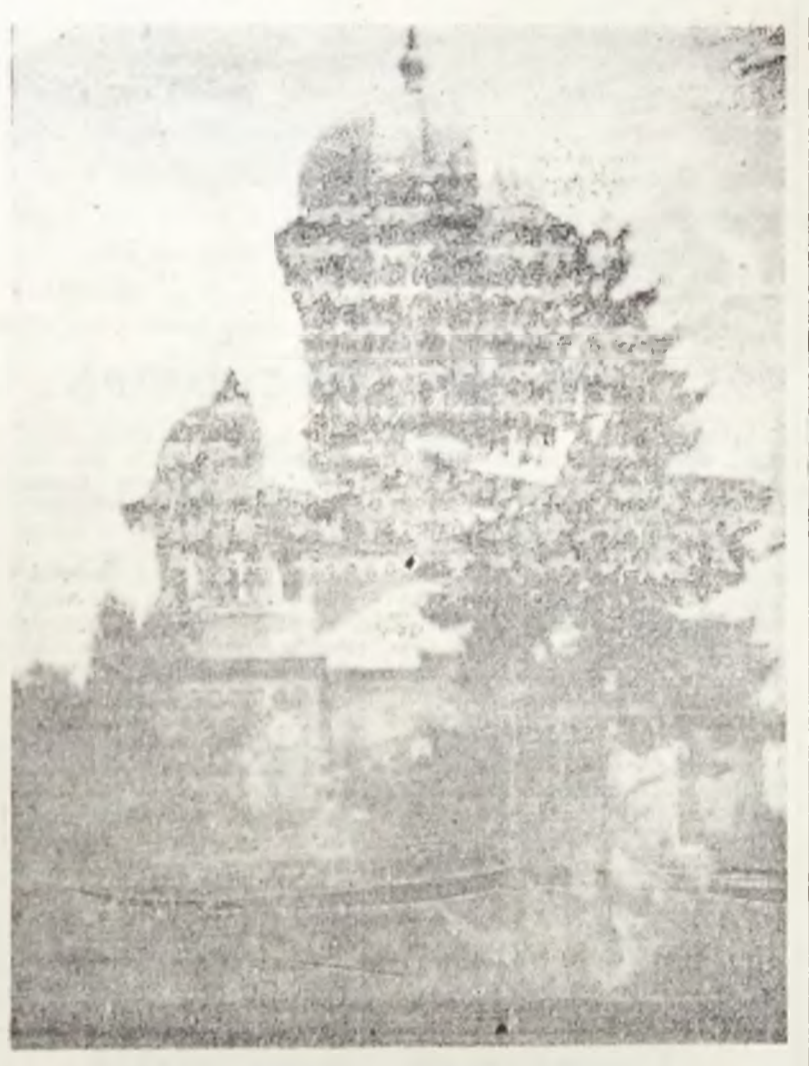
Turle îndreptate spre cer - statornice simbolului ate păcii.