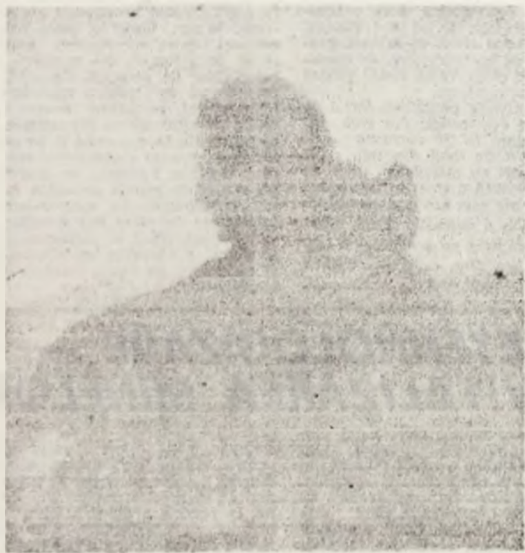
Privind lumea de sus...