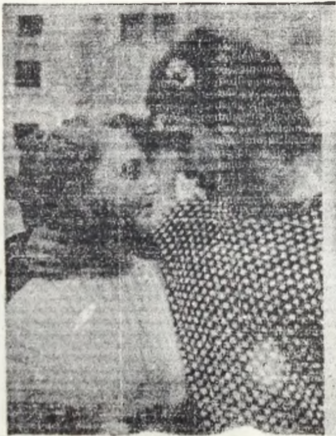
Totul a început cu „un el și o ea”, iubire — sensul existenței pe Pămînt.