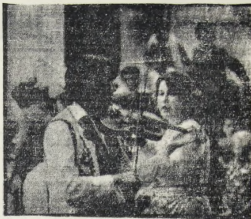
Zi-i din scripcă, lăutar.