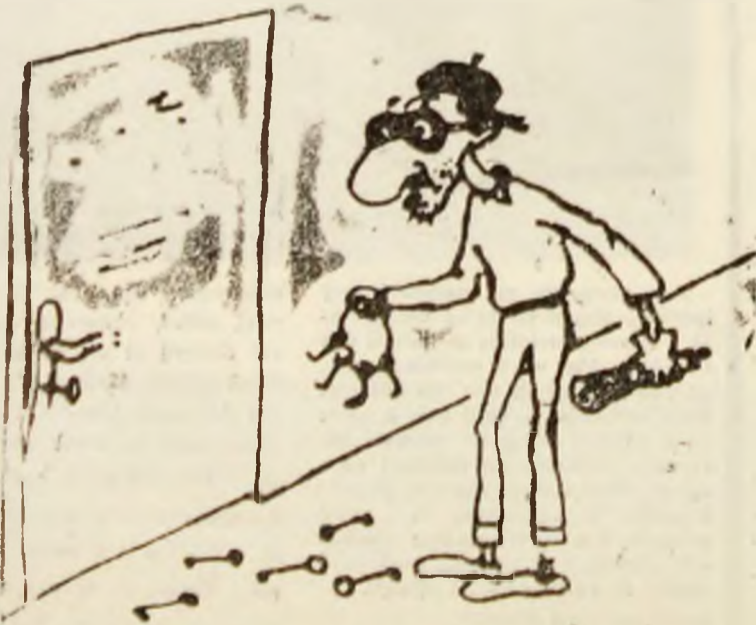
— Deși urmăresc de fiecare dată la TV emisiunea „Cheia succesului” mă urmărește un ghinion teribil.

Mai deunăzi ne-a vizitat la redacție dl. M.G. din Uricani, care face traseul cam săptămînal, întipărîndu-se în memorie costul biletilor Uricani — Petrosani, 25 lei. Dar iată că, într-o zi, omul are ghinion. Fusesse pînă la Lupeni după cumparatură. Biletul, 10 lei. De acolo a trebuit să ajungă la Petroșani în trei zile urgente. Pune banii jos — la 10, dar după ce „biletul pînă la Petroșani este 20 lei”, îi răspunde taxatoarea, fără cauzon și dialogul se infiripa în termeni nepoliticoși, dar pe buzunatul călătorului. Așadar socoteala de acasă nu se potrivește cu cea din țîg. Autobuzul cu numărul 31-110-378. Un caz izolat, dar care generează întrebări și mai ales răspunsuri. Răspunsuri la toate capitolele. Dar ne ajută ele la ceva?