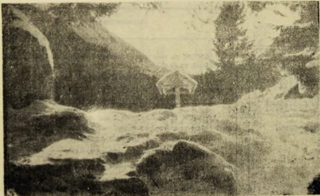
A fost zăpada mieilor?

Doamne, și cît de amărite sînt fetele noastre primăvara, cînd vînticelul acesta cald le dă pe nas sau pe obrăjori, pistrui!