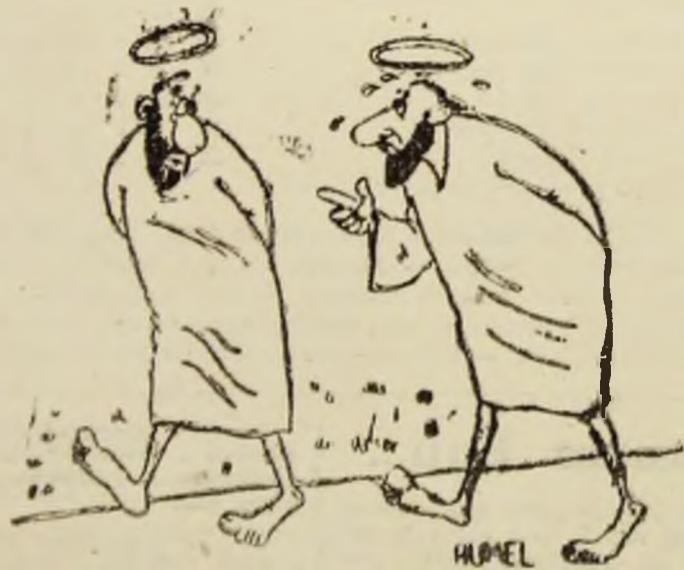
— Ai auzit că vor fi date la iveală fișele cu informatori ?

Adunarea deputaților a hotărât luni, 1 iunie ca alegerile legislative și prezidențiale să se desfășoare în data de 26 iulie ac., cu o campanie electorală aferentă. Cum decizia parlamentarilor a fost luată chiar de Ziua copilului, nu este exclus ca stabilirea datei alegerilor, după atâtea dispute, mai mult sau mai puțin creștinești, să aiba drept principala motivație viitorul copiilor noștri. (G.C.)